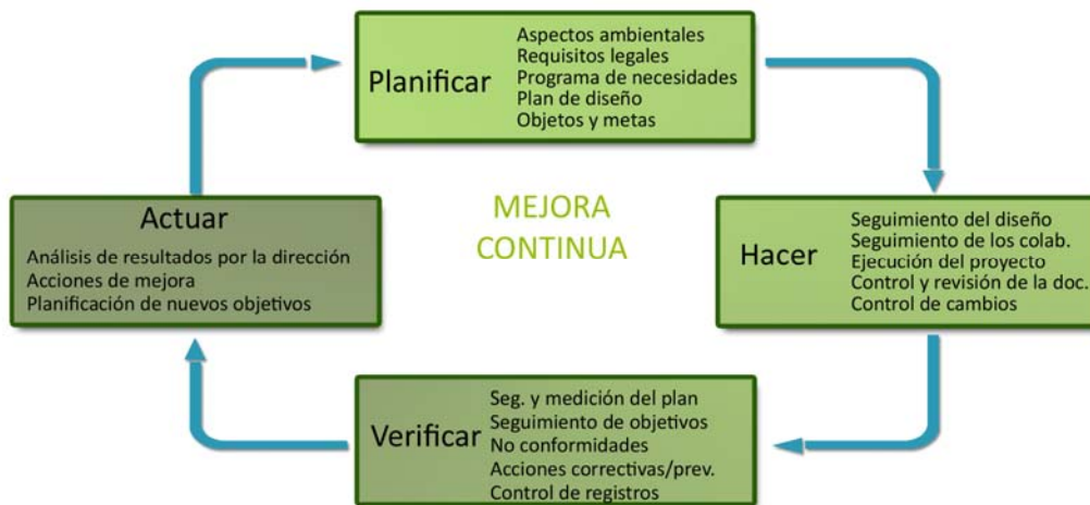
Figura 1. Metodología de control de calidad PDCA (Plan-Do-Check-Act) Planificar, Hacer, Actuar, Verificar, basado en las investigaciones realizadas por P. C. Palmes 2010

[8] que permite identificar los "puntos críticos" de un proceso y, posteriormente, desarrollar y evaluar las diferentes alternativas.