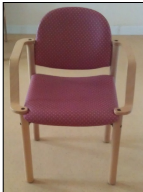
Figura 2b. Silla con reposabrazos