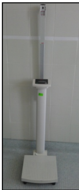
Figura 2a. Báscula y Tallímetro

rango de pesaje entre 2 kg y 250 kg \pm 100 gr y tallímetro con rango de medición entre 60 - 200 cm \pm 1 mm (Figura 2a), reloj marca Casio modelo número 2575 con cronómetro 1/100, cinta métrica Acha modelo 54-801 con rango de medida entre 0 cm y 30 metros y con marca milimétrica, dos picas con base para marcar la distancia de las pruebas, silla con reposabrazos (Figura 2b), escalón de madera de 7,5 cm de altura (Figura 2c) y tablas para la recogida de datos.