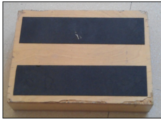
Figura 2c. Escalón de madera