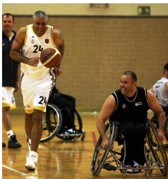
Foto derecha 2. Baloncesto inclusivo de profesionales