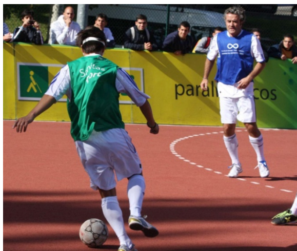
Foto superior 1. Práctica inclusiva de ciegos

VVAA (2006) "Paralympic School Day" (en línea), acceso el 04-10-2012 http://www.paralympic.org/TheIPC/WWD/ParalympicSchoolDay