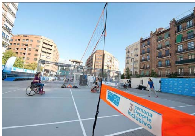
Foto 6. Bádminton inclusivo