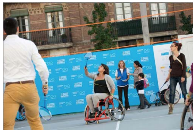
Foto 8. Bádminton inclusivo