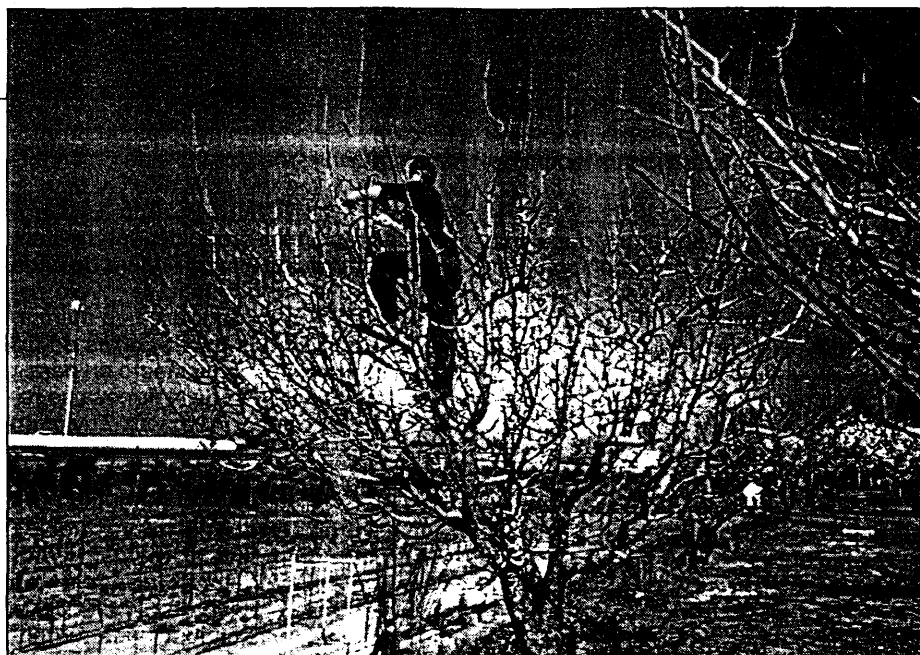
Poda de árboles frutales en los campos de prácticas de la Escuela Técnica Superior de Ingenieros Agrónomos de Madrid.

-Material plástico amortiguador, superficie plana. Alturas: 20, 40 y 60 cm.