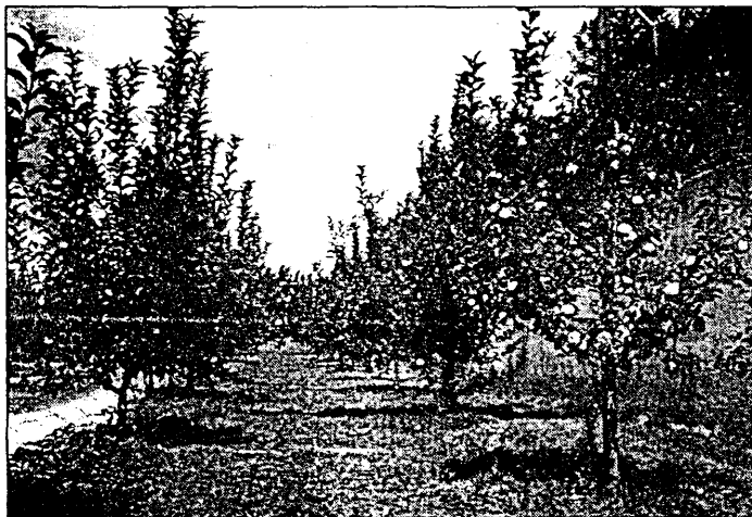
Colección de manzanos en la Escuela de Ingenieros Agrónomos de Madrid.

por: J.L. García, M. Ruiz-Altisent y M. Vicente