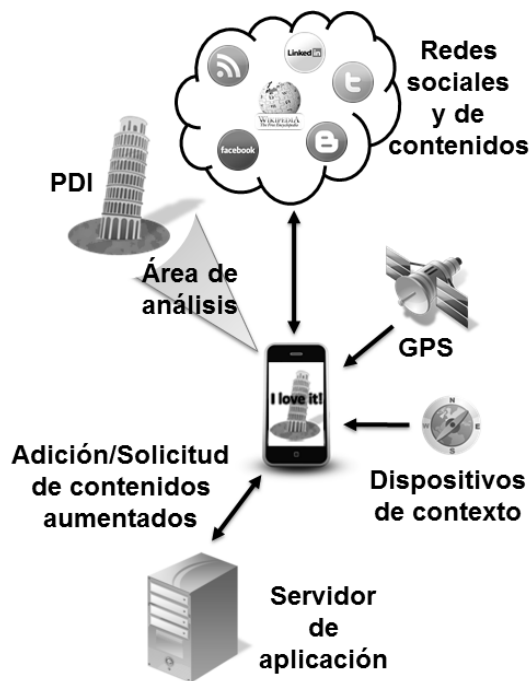
Fig. 3. Arquitectura general del nivel de colaboración social.

En este caso la arquitectura es más compleja que en el nivel inferior ya que ha de soportar la colaboración entre diferentes participantes, tal y como puede observarse en la Figura 3. El servidor de aplicación tiene que permitir la adición dinámica de contenido, mientras que la parte cliente es similar a la descrita para el nivel Aislado, con la capacidad extra de subir contenido al servidor y de aceptarlo de diversas fuentes.