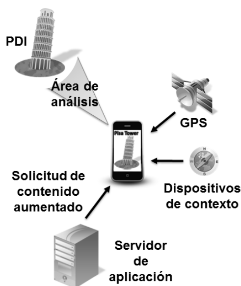
Fig. 2. Arquitectura general del nivel de colaboración aislado.

Sin embargo, este es un nivel que es importante estudiar no solo por la existencia de un gran número de aplicaciones que concuerdan con sus características, sino también por ser la base tecnológica y arquitectural del resto de niveles superiores.