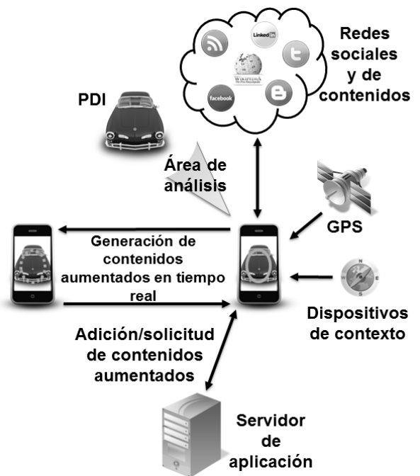
Fig. 4. Arquitectura general del nivel de colaboración en tiempo real.

El nivel superior de la pirámide corresponde a las aplicaciones que comparten capas de información generadas en tiempo real. Específicamente, en este tipo de aplicaciones dos o más usuarios se conectan entre ellos para contribuir en la generación en vivo del contenido aumentado en forma de capas sobre el PDI capturado por uno de los usuarios. El contenido generado puede ser compartido de cara a estar disponible para usos futuros aprovechando la conexión con redes sociales o servidores propios del nivel anterior.