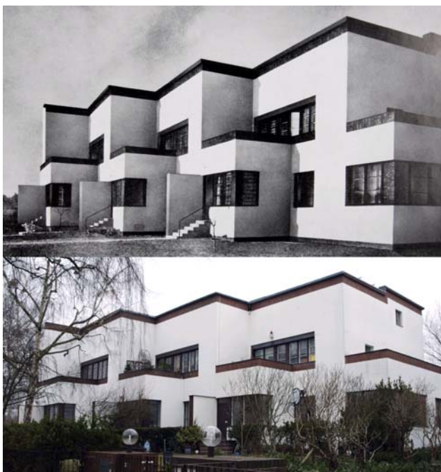
Fig.2. Fase 1. Casas de muro portante de ladrillo (1930 y 2010)

posteriores, por lo que lo consideramos como una fase más, que llamamos 1B.