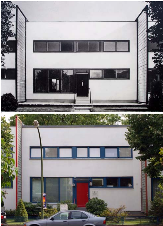
Fig. 4. Fase 3. Casas de Hormigón (1930 y 2010)

estructura de hormigón armado lo que le permite una espacialidad interior libre de pilares. Esta compuesta por una serie de cuatro viviendas adosadas de mayor frente que fondo (lo que mejora las condiciones de iluminación). La estructura apoya únicamente en pantallas de hormigón medianeras y en la caja de escaleras central, dejando un interior sin condicionantes estructurales, y permitiendo en ambas fachadas la introducción de fenêtres en longueur ininterrumpidas a lo largo de los frentes de cada casa. El nombre de Luxferstern se debe a la presencia de paramentos de vidrio impreso verticales que marcan la separación entre casas. La paleta cromática usada para carpinterías y elementos singulares —rojo, azul, amarillo— remite a los códigos habituales del neoplasticismo.