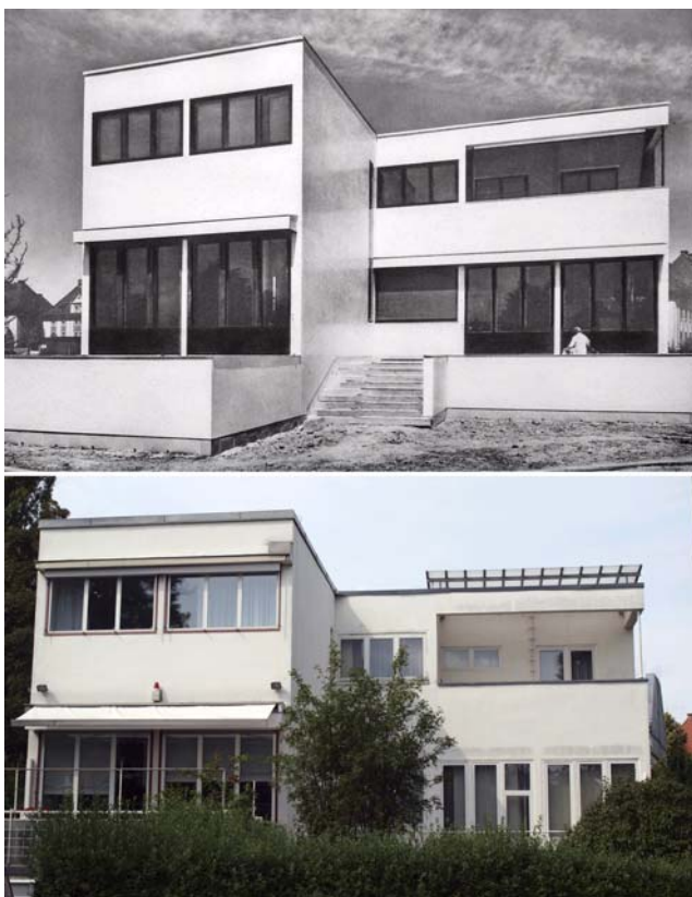
Fig. .3. Fase 2. Casas de estructura de acero (1930 y 2010)

Las características de cada fase se resumen a continuación: