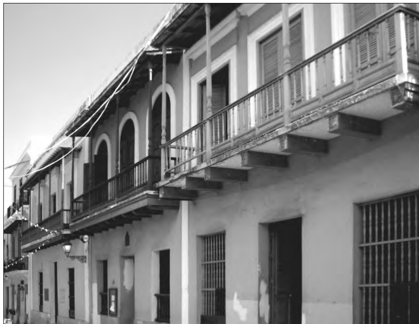
FIGURA 5: Balcones en la calle Cristo de San Juan, donde se ven los canes, cortados a escuadra, que han quedado descubiertos al desprenderse la tabica que los oculta

damos situarlo en los antepechos opacos de tablas —dispuestas en vertical— que aún se conservan en las arquitecturas montaÑesas del norte de España. Progresivamente, la labor estÉtica sobre el antepecho de los balcones y solanas fue reduciendo la parte opaca al ir perfilando las tablas con diversos motivos y con la incorporaci3n de balaustres; esto ya en  pocas m s recientes y en construcciones m s nobles. En alg n texto antiguo encontramos que el uso principal de los balcones era que las «damas nobles, y castas» 66 , pudiesen solazarse con las vistas hacia la calle. Con el fin de evitar las vistas indiscretas desde la