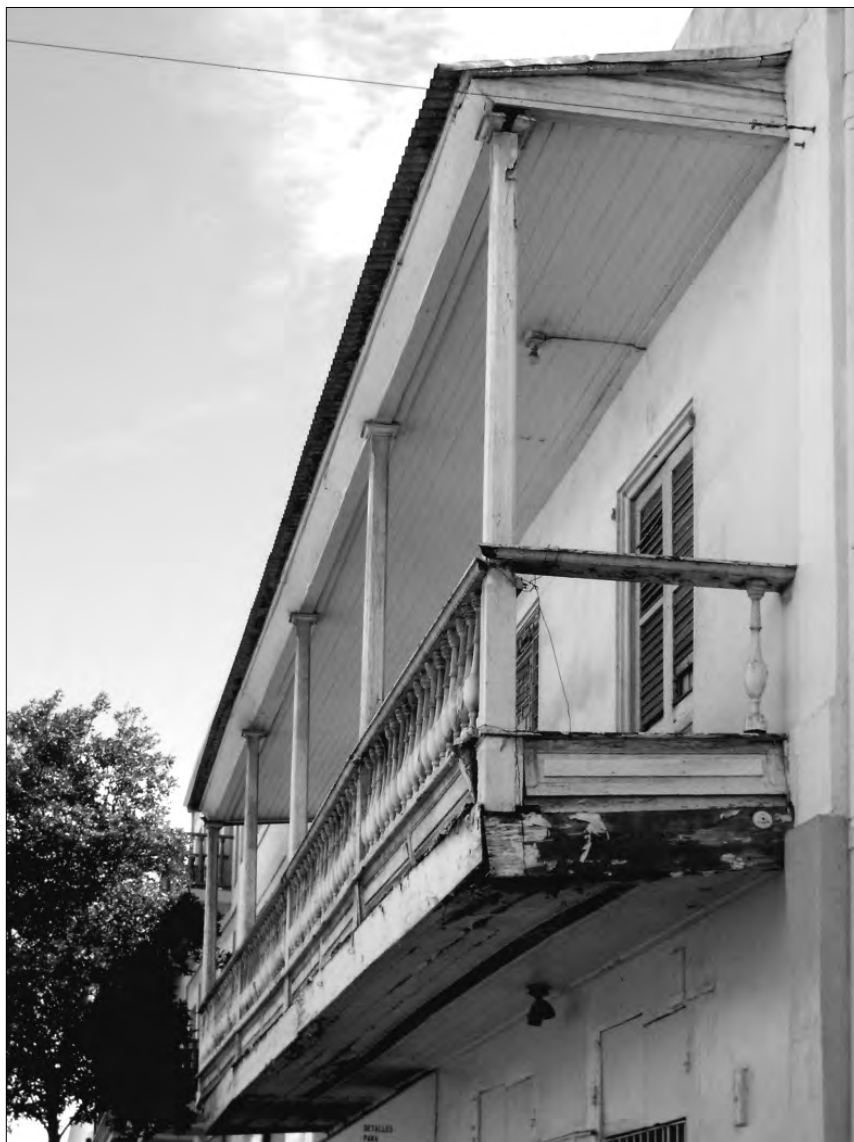
FIGURA 9: Balcón en Ponce

distintivo de la época. El edificio de la Inquisición de Cartagena de Indias, de 1770, presenta balcones corridos de 3 y cuatro