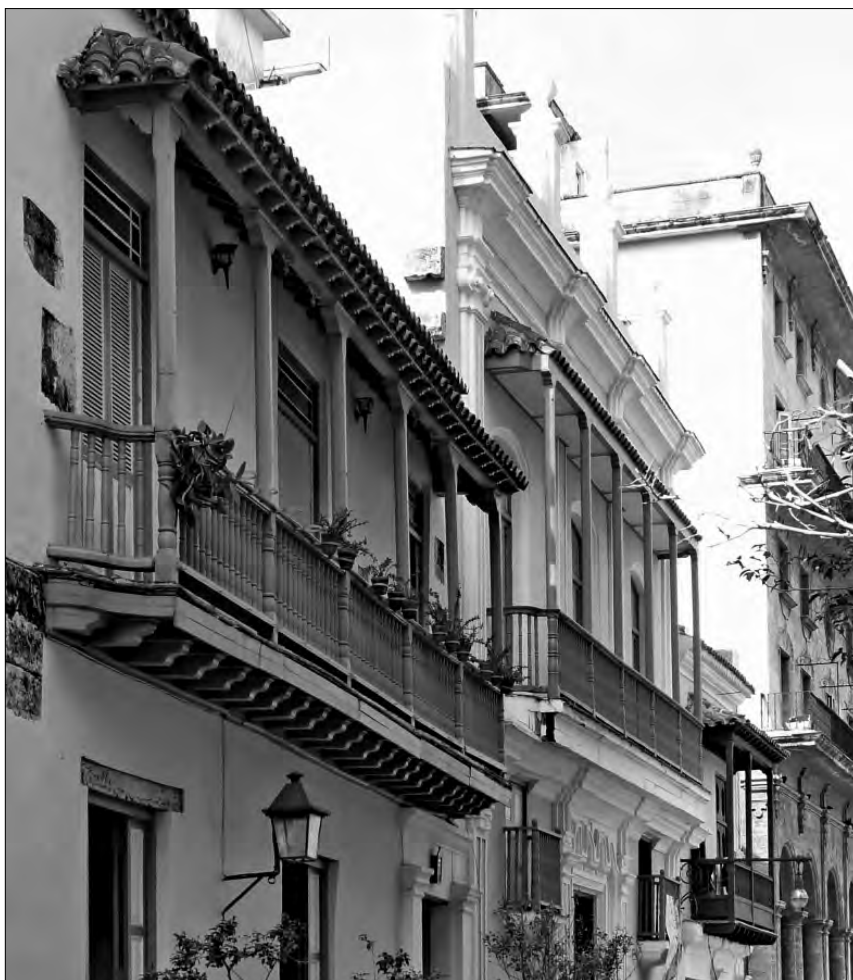
FIGURA 2: Balcones en la calle Oficios llegando a la plaza de San Francisco en La Habana (Cuba). A pesar de ser ejemplos tardíos del siglo XVIII, que se observa por el lateral de perfil curvo cóvexo-cóncavo, conservan las zapatas entre los pies derechos y la carrera así como el faldón lateral del tejeroz

Precisamente sobre el origen de los balcones cubanos —que se empezaron a levantar en el siglo XVII—, el profesor Prat Puig diserta de forma abundante. Tras exponer las teorías arquitectónicas