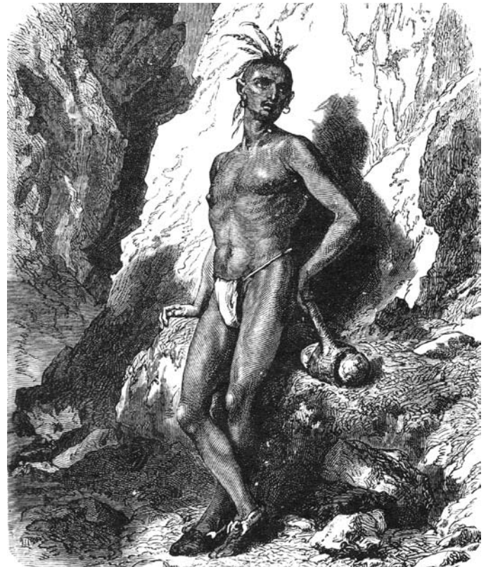
Figura 7. Indio americano con un martillo de piedra. Según Simonin (1867).

Figure 6. Stone hammers from the Ancient copper mines of the province of Cordoba and of the Lake Superior (from Simonin, 1867).