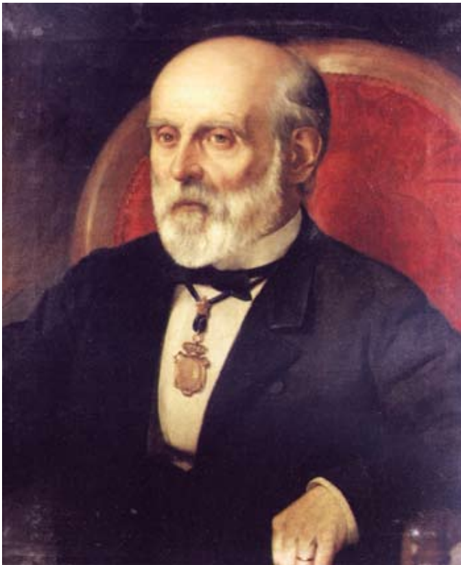
Figura 2. Juan Vilanova y Piera.

Como veremos en este artículo, uno de los mayores valedores, en España y en el extranjero, de la existencia de una Edad del Cobre previa a una Edad del Bronce, al menos para España fue Juan Vilanova y Piera (1821-1893) (Fig. 2), de quien a su muerte el naturalista Francisco Quiroga (1853-1894) decía que fue " de los primeros en sostener la existencia indudable en el desarrollo de la civilización humana de un periodo del cobre precursor del de bronce y primero de la edad de los metales, periodo que en la actualidad está casi unánimemente admitido " (Quiroga, 1893). Esto tiene especial valor, por cuanto Quiroga era en la práctica un contradictor sistemático en los postulados de Vilanova en la Sociedad Española de Historia Natural.