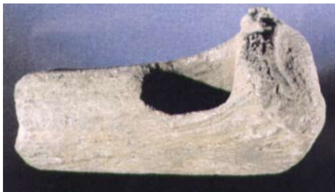
Figura 5. Martillo de asta de ciervo de la mina de El Milagro. Museo de la Escuela de Ingenieros de Minas de Madrid.

Figure 5. Deer-horn tool from the El Milagro mine (Museum of the School of Mining Engineering, Madrid).