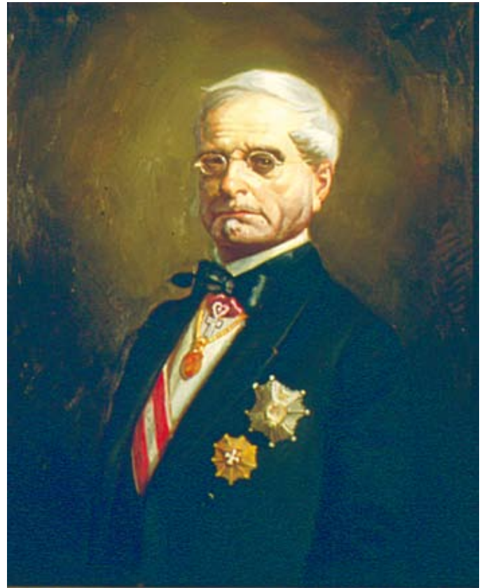
Figura 3. Casiano de Prado. Galería de retratos de directores del Instituto Geológico y Minero de España.

Figure 2. Portrait of Juan Vilanova y Piera (Portrait Gallery at the Ateneo, Madrid).