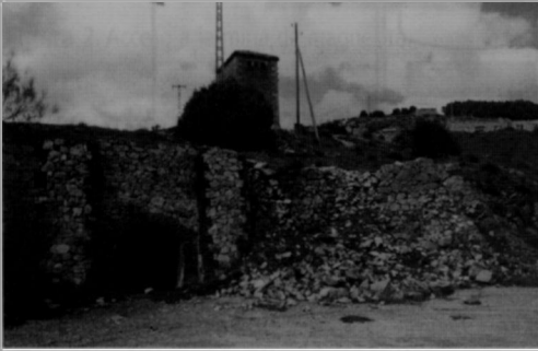
Figura 7. Bocamina. Nivel Superior.