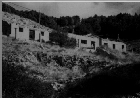
Figura 4. Edificaciones de la mina.