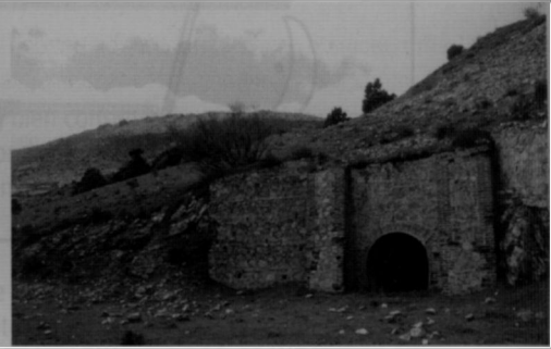
Figura 8. Bocamina. Nivel Inferior.