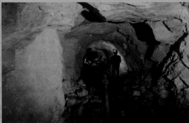
Figura 11. Interior de una galería en el año 2002.

Todo apunta a que en un principio la explotación se realizaba mediante trabajos de interior con dos niveles unidos por un plano inclinado. Parte del material extraído era clasificado por tamaños, mientras que unos camiones esperaban para ser cargados.