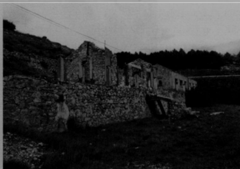
Figura 5. Edificaciones de la mina (').