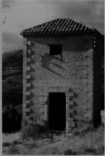
Figura 6. Antigo transformador.

En la galería superior hay un hundimiento en forma de tolva cónica y está cerca de la bocamina; la cual tiene una entrada desde la explanada con geometría curva de 2 m de altura máxima. Pensamos que se produjo por voladura, para así sellar las labores subterráneas. Todos estos elementos están contruidos en un muro de piedra y con ladrillos en algunas partes de la estructura, sobre todo en el contorno de la zona de subsidencia (entrada