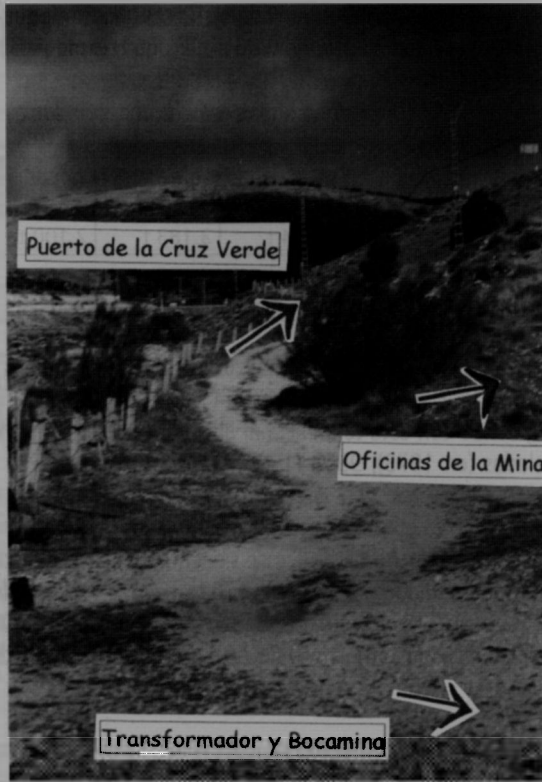
Figura 2. Acceso a la mina de magnesita.

Se trata de tres construcciones de planta rectangular, bien conservadas en términos generales en lo referente a los muros de ladrillos y mampostería, pero con los techos caídos o a medio caer. Están alineadas y sus puertas de entrada se abren a un pasaje de cemento que termina en un muro de unos tres metros de altura.