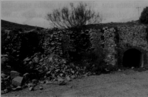
Figura 9. Hornos de calcinación junto a la bocamina superior.