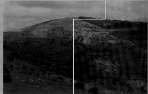
Figura 10. Panorama de la explotación minera.