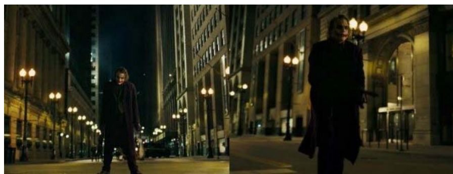
Jocker a sus anchas en Manhattan-Gotham.

Hoy Batman está mejor equipado, la bat-cueva es una extensión del laboratorio de industrias Wayne y su traje parece más veraz, de la misma manera que el Jocker de Jack Nicholson resulta hoy una caricatura desafortunada del fantástico Heath Ledger .