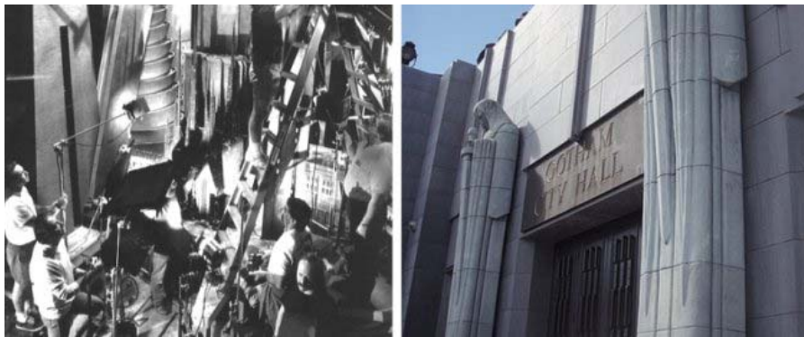
Los decorados que reproducen Gotham, en entregas anteriores de Batman.

Según dijo, deseaba plasmar la ciudad actual y por eso Gotham debía ser básicamente Manhattan, con algunos toques de Chicago y sobre todo Tokio , debido a sus estructuras de transporte elevadas. Incluso Hong Kong aparece para darle la réplica a Gotham.