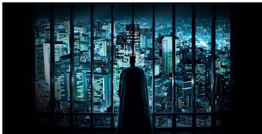
¿Gotham City o Manhattan?

No han transcurrido más que ocho años desde el cambio de milenio y ya parece que un abismo temporal nos separa. Nada hacía presagiar que los gustos de los 90 nos resultaran tan ajenos pocos años después, y sin embargo aquí estamos, renegando de ellos como de los pantalones campana durante la movida. No hay más que fijarse en la última entrega de uno de los superhéroes más famosos del cine: Batman.