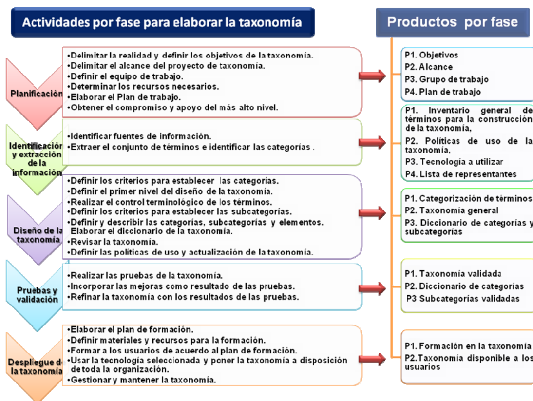
Figura 2. Actividades por fase de la taxonomía y los productos por fase

En la Figura 2 se muestra las principales actividades y productos de las fases del método para elaborar la taxonomía de factores críticos.