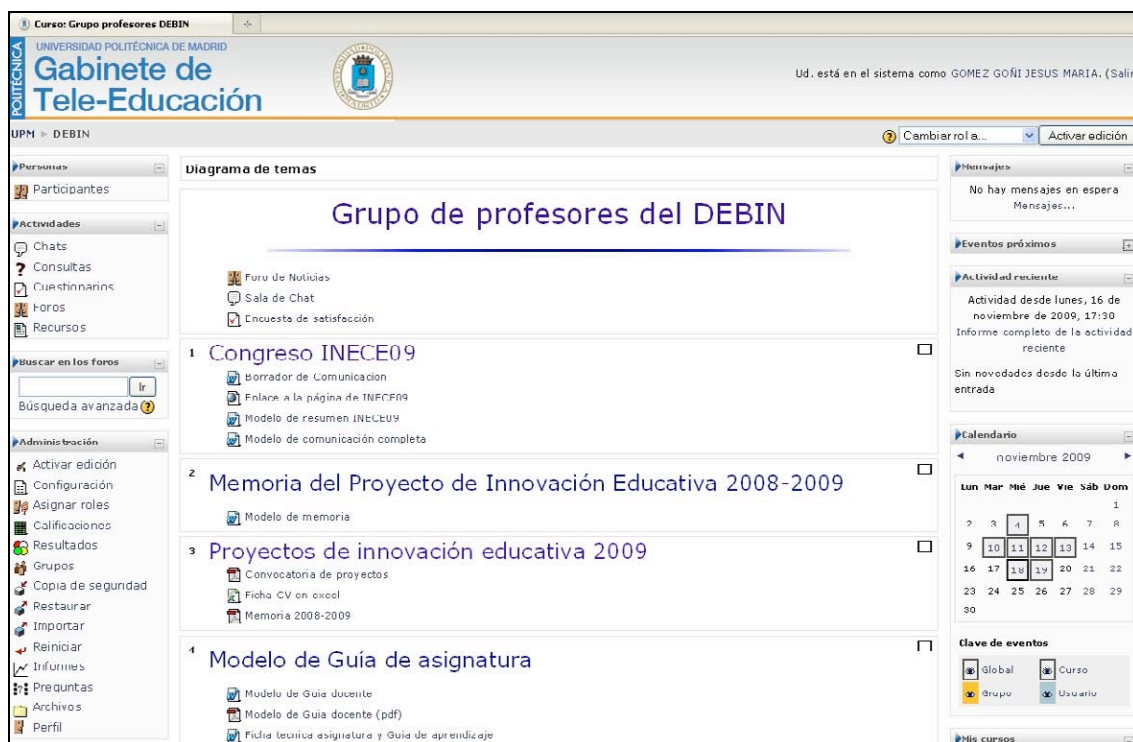
Figura 1: Aspecto de la plataforma moodle para los profesores del proyecto de innovación educativa