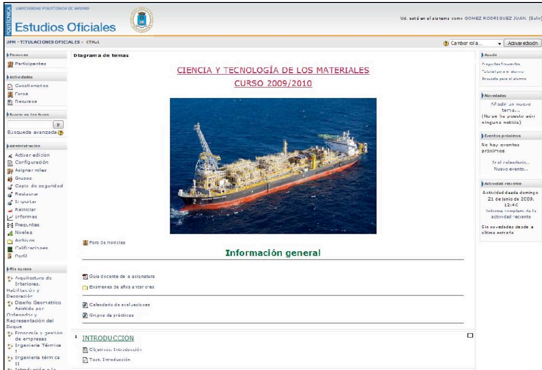
Figura 2: Aspecto de la plataforma moodle de una de las asignaturas del Proyecto de innovación educativa (Ciencia y Tecnología de los Materiales).

alumnos por los aspectos de las plataformas que usan más y los que les gustaría que estuvieran presentes. Los resultados se presentarán en el apartado de las Encuestas.