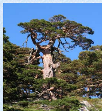
Ejemplar, varias veces centenario, de la sierra de Guadarrama

Es una especie que muestra una notable variabilidad: es uno de los pinos con mayor cantidad de variedades descritas (cerca de 150). Esta gran variabilidad ha recibido diferentes tratamientos en la jerarquía sistemática. Según Gaussen (Ruiz de la Torre, 2006) de los 14 taxa intraespecíficos, 4 están representados o son exclusivos de la península Ibérica: ssp. pyrenaica : Pirineo y Prepirineo, propia de montañas elevadas, con tronco alto rojizo, acículas con 3 a 8 canales resiníferos y haces vasculares aproximados; ssp. iberica : montañas carpetanas e ibéricas, más próxima al tipo de la especie, con tronco alto, con 4 a 8 canales resiníferos en las acículas, uno de ellos central y haces vasculares algo separados; ssp. nevadensis : montañas granadinas, tronco alto rojizo, acículas muy cortas y glaucas, 9 a 13 canales resiníferos centrales y haces vasculares muy separados; ssp. catalaunica : media montaña y Prepirineo, tronco alto amarillizo ocreáceo o claro, 5 a 9 canales resiníferos en posición variable en las acículas y haces vasculares muy separados. En relación con posibles hibridaciones solo se han descrito híbridos naturales con P. uncinata : P. x rhaetica Briggen = P. bougetti (Flous.). La variabilidad expresada por los datos anteriores debe relacionarse tanto con la fragmentación de área derivada de las particularidades orográficas-climáticas de la península Ibérica, como con la condición finícola de la misma.