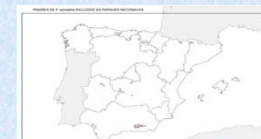
Pinares naturales de P. sylvestris incluidos en parques nacionales

Los pinares de P. sylvestris naturales, en nuestra opinión, no se encuentran suficientemente protegidos, en relación con su importancia biológica y ecológica. Sólo una pequeña parte lo están, pero no por sus valores intrínsecos, sino indirectamente, porque viven en espacios que se han establecido en función de otros criterios (faunísticos, paisajísticos...). De hecho, de sus cerca de 950.000 ha, sólo el 15% aprox. se encuentran dentro de un espacio natural protegido (0,82% en algún Parque Nacional (ver fig.); el 13,47% en algún Parque Natural; y un 0,24% en alguna Reserva Natural).