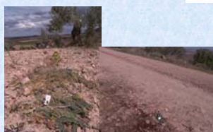
Foto 1. Olivar y camino en S 3 Calera