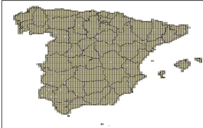
Figura 1. Tesela vectorial de las 4123 hojas del MTN-25.

Para poner en marcha el servicio WMS con la aplicación informática MapServer , se ha utilizado la versión 5.2 de dicha aplicación en un entorno Microsoft Windows y como servicio de páginas Web se ha utilizado Apache Web Server . La puesta en marcha del servicio WMS consiste en crear un archivo de configuración para Mapserver ( MapFile , .map ), en el que se definan los metadatos mínimos del servicio: URL, formato por defecto, datos de contacto, sistemas de referencia espaciales soportados, etc. y publicar una capa indicando que se trata de un archivo de índice. Dado que se trata de archivos dgn , en los que se almacena un estilo predefinido, se ha de indicar a MapServer que aplique los estilos automáticamente.