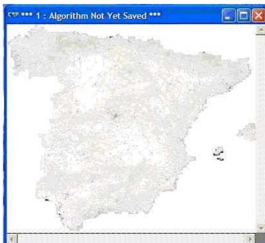
Figura 3. Resultado final del proceso. Mosaico del Mapa Topográfico Nacional 1:25.000 en un único archivo raster formato ECW

Así por tanto el conjunto de tareas necesarias para implementar este método son: