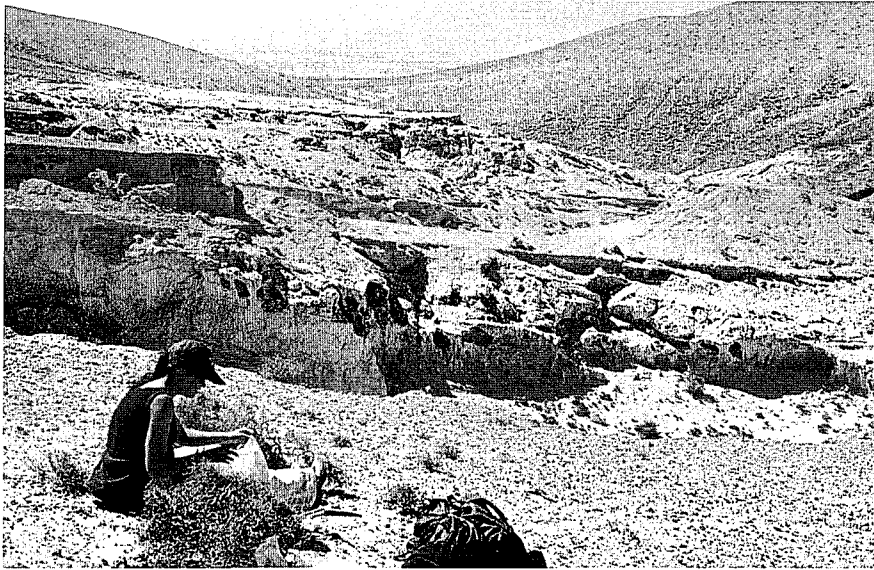
Fig. 2.- Vista general del depósito eólico de Barranco de los Encantados, norte de Fuerteventura.