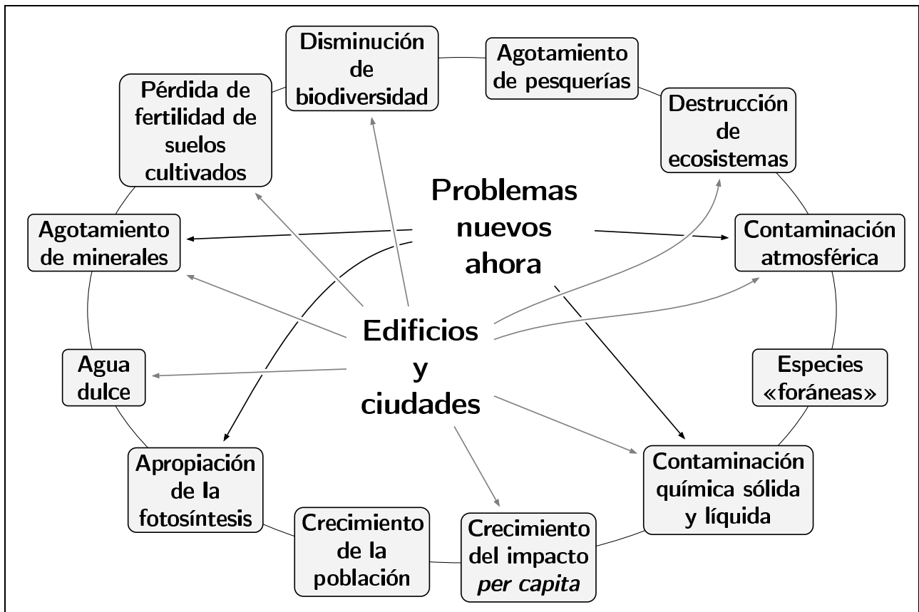
Figura 1: La crisis ecológica.