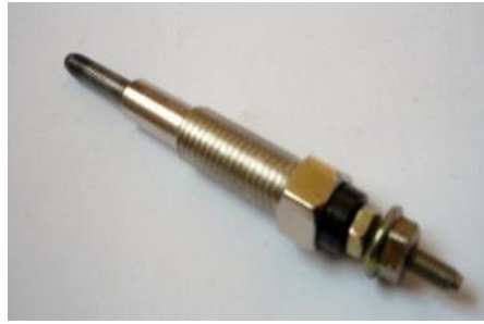
Gambar 4. Busi pemanas glow plug