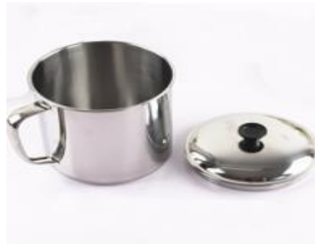
Gambar 5. Cangkir 12 cm