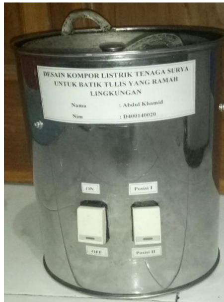
Gambar 2. Kompor listrik

Desain kompor listrik tenaga surya untuk batik tulis ini menggunakan energi alternatif atau energi terbarukan. Hasil data yang diperoleh dari berbagai sumber kemudian diaplikasikan guna membuat kompor listrik tenaga surya gambar 2, panel surya gambar 3, busi pemanas atau glow plug gambar 4, dan cangkir gambar 5.