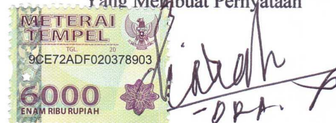
Diah Ratih Anggraini