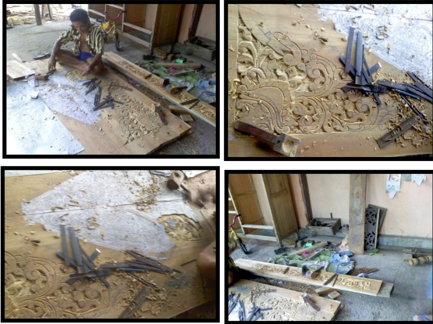
Gambar 1.5 Kegiatan Pembuatan Ukir Kayu di Sanggar