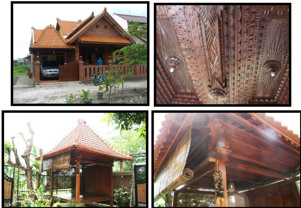
Gambar 1.6 Karya Ki Djarot Dalam Bidang Arsitektur