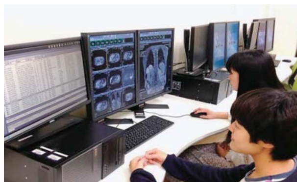
Fig. 6. “Seminar on Diagnostic Procedures for Cancer Imaging” practicing aspect at the Komazawa Campus Building 7-105

KOMA imaging) の開発には文部科学省がんプロフェッショナル養成基盤推進プランの助成を受けた。また英文校正で支援を受けたエディテージ (www.editage.jp) の関係者に謝意を表す。