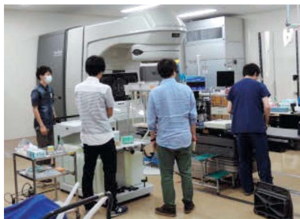
Fig. 3 “Seminar on Radiation Therapeutics” practicing aspect at the Cancer Institute Hospital of JFCR

修了者数は 3 名で，進路先の内訳は 2 名が自治体総合病院に勤務，残り 1 名が大学院博士後期課程に進学している (Table 2).