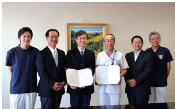
Fig. 4. Industry-academia partnership agreement with the Hokuto Hospital (Photo shoot on June 10, 2013)

臨床画像読影のためのハードウェアと専用ソフトウェアを擁した端末4台と教育用大型モニタを設置した(Fig. 5)。「がん画像診断総合演習」ではがん遠隔画像診断における各種モダリティの特徴と検査適応、画像管理の標準化と制度管理、セキュリティ対策に関する講義に加えて、遠隔画像診断支援教育用ソフト(e-KOMA imaging)を用いた演習を行っている(Fig. 6)。このコースの4年間実績は、募集人員数2名に対し、平成27年度は入学者がいなかったものの各年度の入学者数は順調で充足率87.5%となっている(Table 2)。平成28年4月時点での修了者数は5名で、進路先の内訳は2名が大学病院勤務で、一般総合病院勤務、大学院博士後期課程進学および獣医学部進学がそれぞれ1名ずつである(Table 2)。