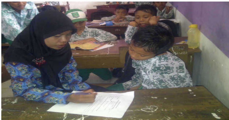
Peneliti sedang mengadakan wawancara dengan RN pada hari Selasa, 28 Oktober 2014 di MIS Muslimat NU Palangka Raya