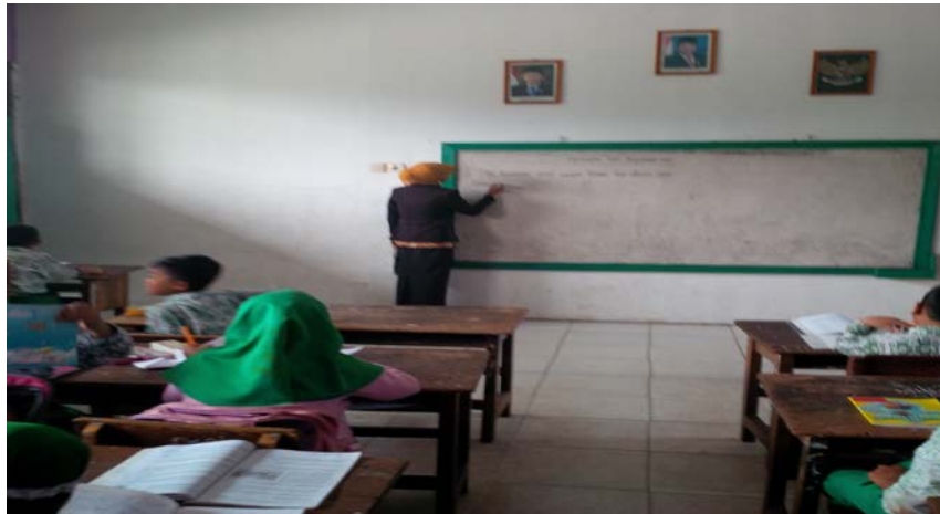
Peneliti sedang mengadakan Observasi pada hari Selasa, 7 Oktober 2014 di MIS Muslimat NU Palangka Raya