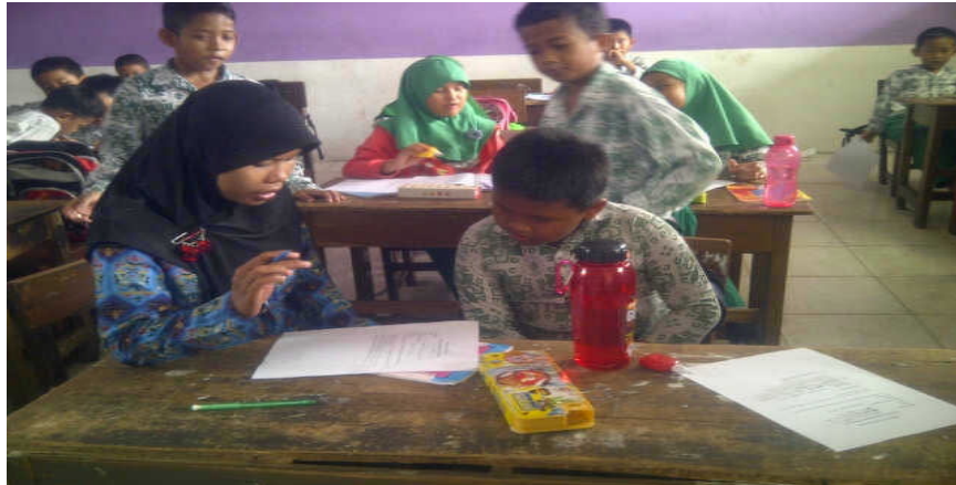
Peneliti sedang mengadakan wawancara dengan MZ pada hari Selasa, 14 Oktober 2014 di MIS Muslimat NU Palangka Raya