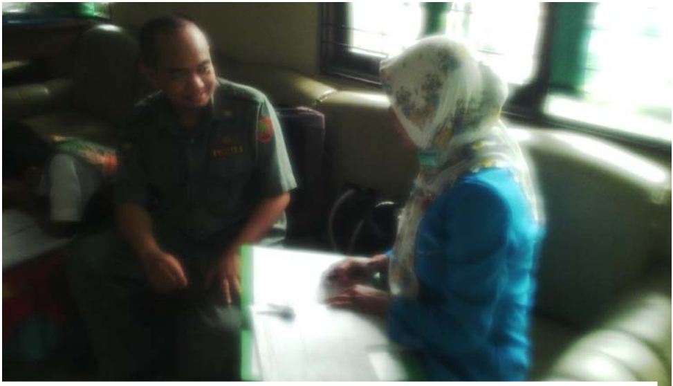
Peneliti sedang mengadakan wawancara dengan Mr di MIS Muslimat NU Palangka Raya