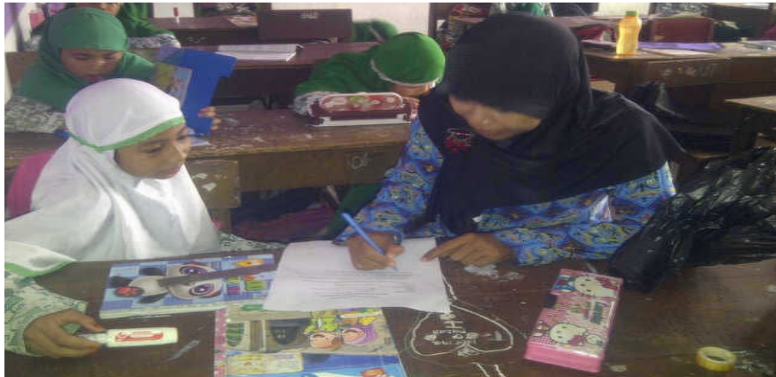
Peneliti sedang mengadakan wawancara dengan Ra pada hari Selasa, 14 Oktober 2014 di MIS Muslimat NU Palangka Raya