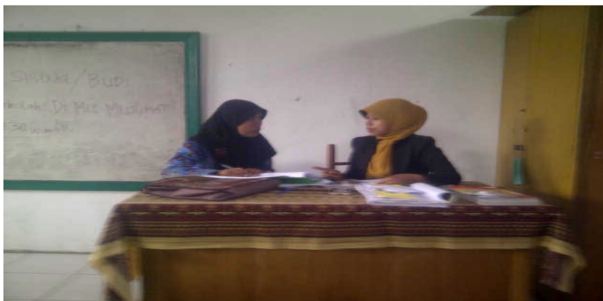
Peneliti sedang mengadakan wawancara dengan Hi pada hari Selasa, 7 Oktober 2014 di MIS Muslimat NU Palangka Raya