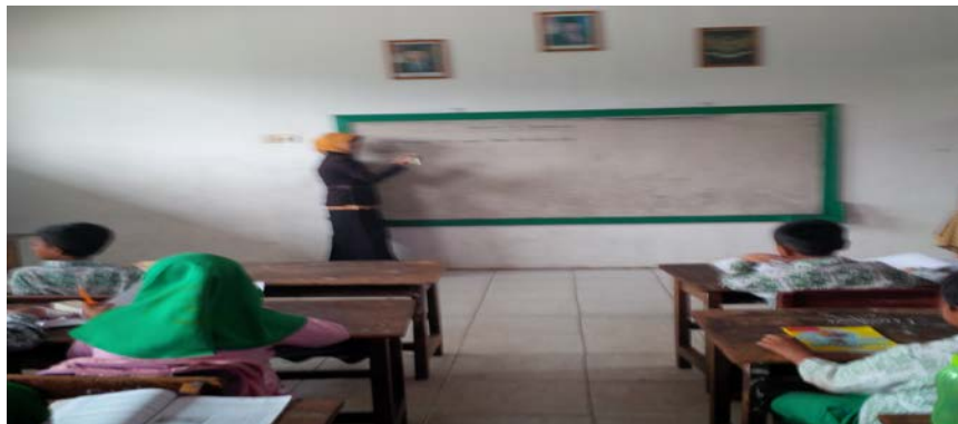
Peneliti sedang mengadakan Observasi pada hari Selasa, 21 Oktober 2014 di MIS Muslimat NU Palangka Raya