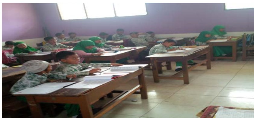
Suasana siswa sedang belajar ketika peneliti mengadakan observasi di MIS Muslimat NU Palangka Raya