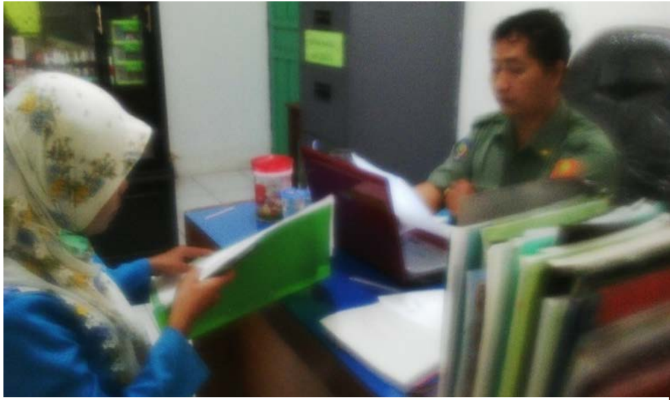
Peneliti sedang mengadakan wawancara dengan MR pada hari Senin, 20 Oktober 2014 di MIS Muslimat NU Palangka Raya