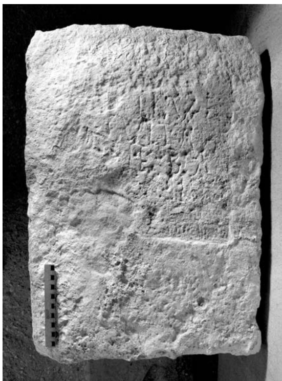
Fig. 5: Estela funeraria de Carboneras (Foto: J. M. Abascal).

-----? [- - -] L L V · f(ili-) [po]suit · ma- [t - -] + E · BA[-] [- - -] h(ic) [s(it-) e(st)] -----?