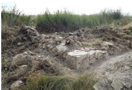
Fig. 2: Altar de Villarejo de Fuentes in situ en el momento del descubrimiento.

A unos 1300 m al N del lugar de hallazgo de esta estela se encuentra el yacimiento de Los Villares, con unas dimensiones de casi 24 ha y numerosos restos cerámicos en superficie. El lugar ha sido prospectado en el ámbito de proyectos como “El territorio ibérico en la Manchuela” 2 (Valero 2008: 160 ss.) o “Carta Arqueológica de Ledaña” 3 , lo que ha permitido el análisis de una muestra de material cerámico que, pese a ser aleatoria, indica una presencia humana en tiempos ibéricos y una mayor intensidad de ocupación en época romana. No existen otros testimonios que apunten a la presencia de un yacimiento bajo el trazado urbano de la localidad. En todo caso, el hallazgo de la estela de un soldado sin ciudadanía, es decir, habitante de un enclave estipendiario, apunta a la existencia aquí de una necrópolis asociada al enclave de Los Villares ya citado.