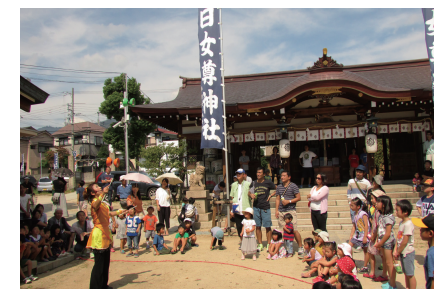
大日女尊神社例大祭（9月）