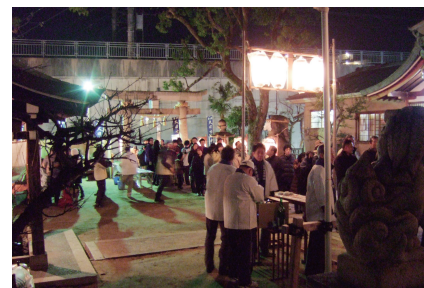
大日女尊神社初詣（1月）