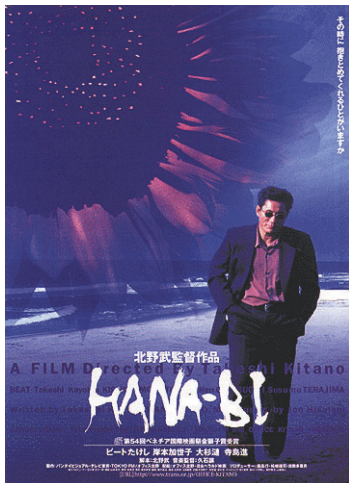
図3 - 1 (カラー図版)