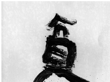
図1-1 井上有一《貧》1972年、紙に墨/軸装 125.0×180.0cm、京都国立近代美術館蔵