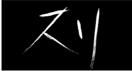
図4-2 《スリ》黒木和雄監督、2000年、 製作会社：アートポート