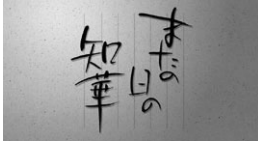
図4-1 《またの日の知華》原一男監督、2003年、 製作会社：疾走プロダクション