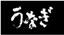
図4-3 《うなぎ》今村昌平監督、1997年、 製作会社：今村プロダクション