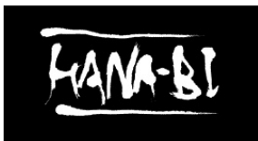
図3 - 2 《HANA-BI》北野武監督、1997年、監督 作品、製作会社：オフィス北野

用のポスターあるいはチラシ、看板などにおいて見られることが想定される。したがって映画のあらすじを説明する前に、そうした平面上に見られるもの(図3 - 1)から、《HANA BI》の特質を抽出したい。 人気のない海辺を独り、少しうつむき加減でこちらへと向かって歩く中年の男(ビートたけし)が画面右手中段に見える。彼の背後には花火に見立てられた半透明のヒマワリが上がっている。ここには実物のヒマワリの写真が用いられ、花の瑞々しさと同時に生々しさが表出している。右肩には、「その時に抱きとめてくれるひとがいますか」というキャプションが入り、タイトル《HANA BI》は画面下およそ四分の一、中央に配されている。画面全体の基調色は北野がこだわって用いる落ち着いた青色だ。そこに《HANA BI》の白さが際だっており、タイトル文字の層が手前へと浮き上