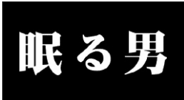
図4-4 《眠る男》小栗康平監督、1996年、 製作会社：眠る男製作委員会