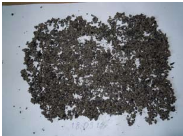
Рис. 4. Шлак при использовании присадки