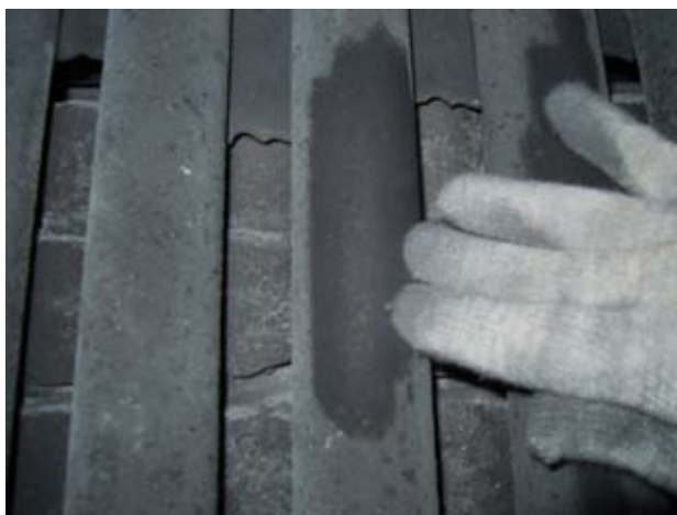
Рис. 3. Вид труб левого экрана после испытаний