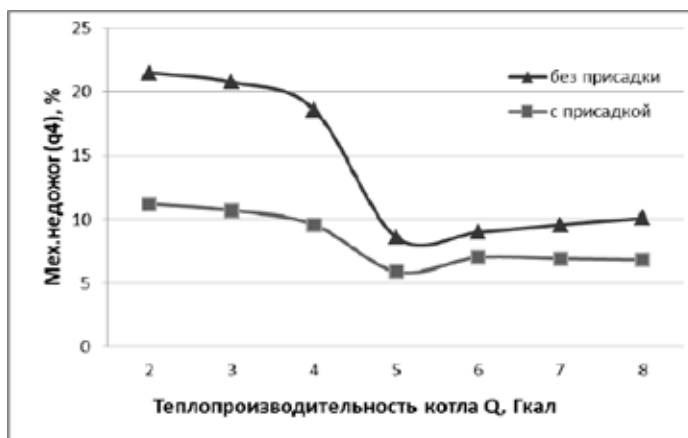
Рис. 1. График эффективности сжигания угля при работе котла на разных мощностях