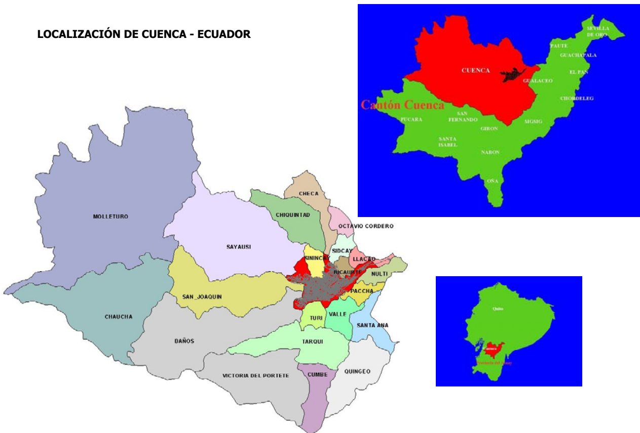
LOCALIZACIÓN DE CUENCA - ECUADOR

En las condiciones actuales, se plantean como principales desafíos locales y regionales: fortalecer las propuestas de descentralización; consolidar la presencia de la Municipalidad como expresión del poder local; consolidar el tejido institucional que acompañe los procesos de desarrollo local; avanzar colectivamente en la identificación de programas de desarrollo económico que potencien las capacidades; propiciar políticas de integración; formular políticas económicas redistributivas; elaborar propuestas para canalizar productivamente los recursos que se remiten por la migración; fortalecer las formas organizativas de la sociedad, los espacios de participación y las prácticas democráticas; establecer mecanismos de control ciudadano.