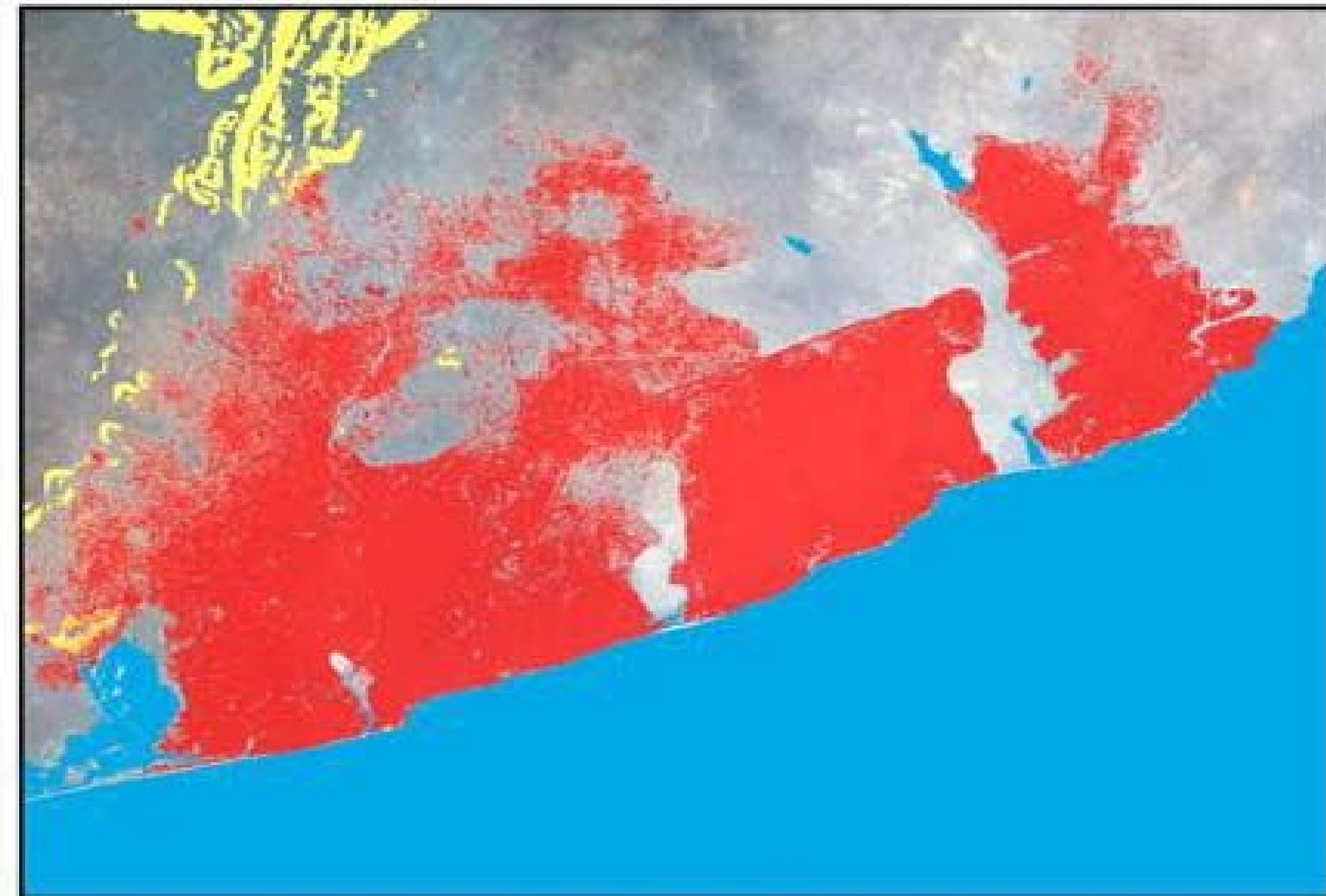
T 2 : 4-Feb-00