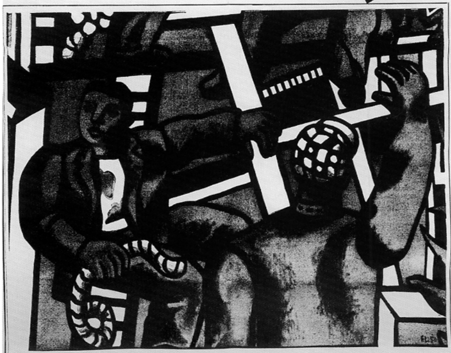
A gauche: Les Lettres françaises, 1951, n° 366, page de titre.