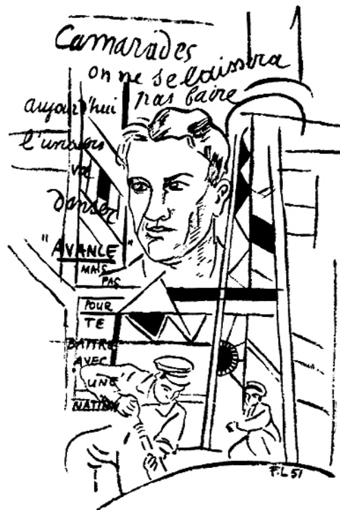
Fernand Léger, dessin pour le poème de Maïakovski «Camarades, on ne se laissera pas faire!», Les lettres françaises, 1951, n° 371. Bibliothèque cantonale et universitaire, Lausanne.

l'art soviétique, dont les reproductions ont été jusqu'alors soigneusement censurées en France 10 . Le cas de l'architecture reste à étudier de ce point de vue, mais elle n'est apparemment guère mieux lotie, sauf à se fondre dans le "grand plan stalinien" de transformation de la nature et de la ville 11 .