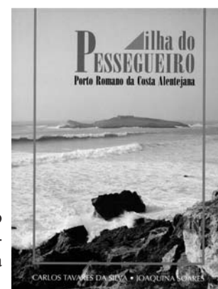
Fig. 4 - Capa da publicação dedicada às escavações arqueológicas realizadas na ilha do Pessegueiro.