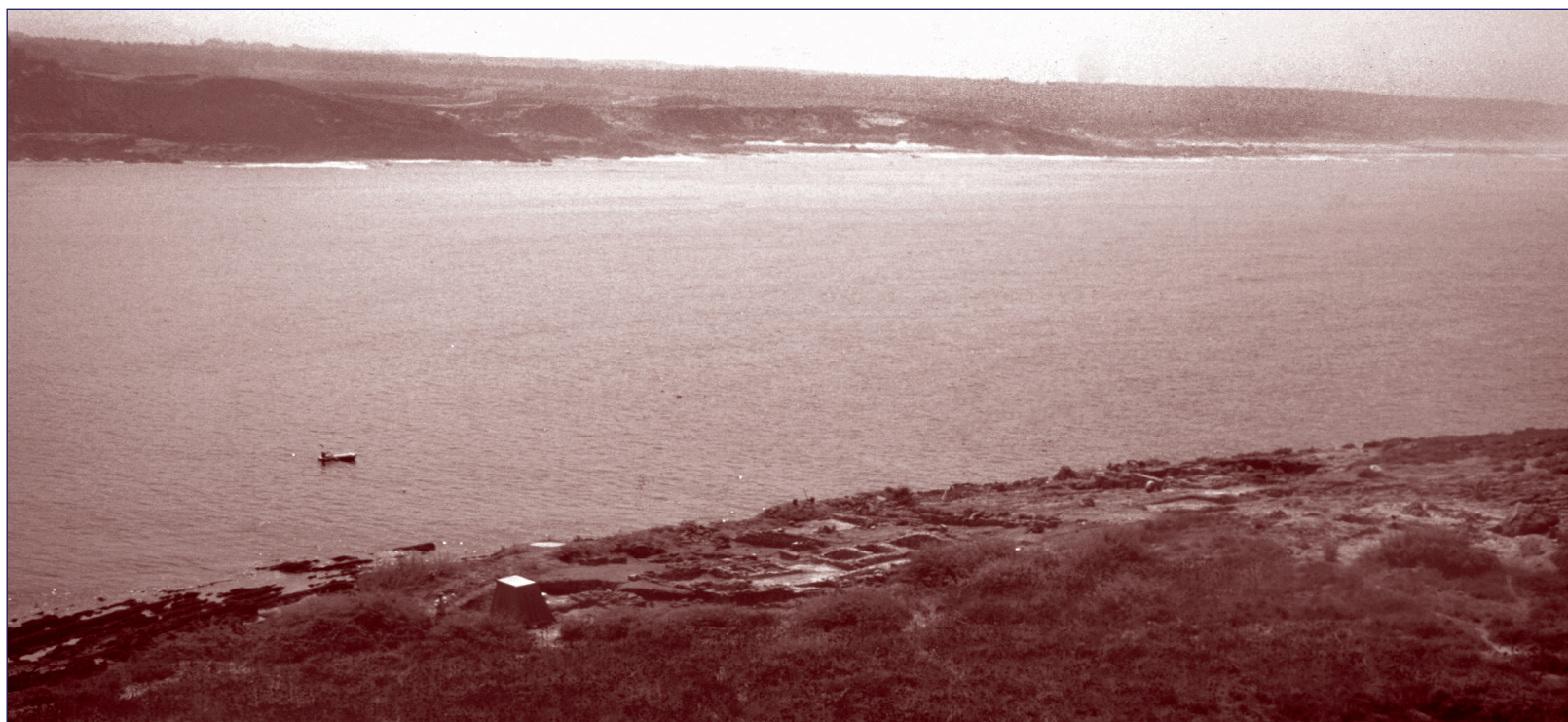
Fig. 1 - Ilha do Pessegueiro. Vista geral da escavação e do braço de mar que a separa de terra. Aqui decorreram as aulas práticas do curso de Antropologia Pré-histórica do MAEDS. Seg. Tavares da Silva & Soares, 1993.

The author presents a free superior course of Prehistoric Anthropology organized by the Museum of Archaeology and Ethnography of the District of Setubal (MAEDS) between 1980 and 1983. This course was pioneer in the teaching of archaeology in a multidisciplinary perspective, including maths and geology. It is also worth to enhance that the course included a fieldwork that took place in the roman harbour of Pessegueiro Island (Sines).