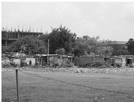
(写真3) インド、ラジャスターン州、州都ジャイプルのスラム