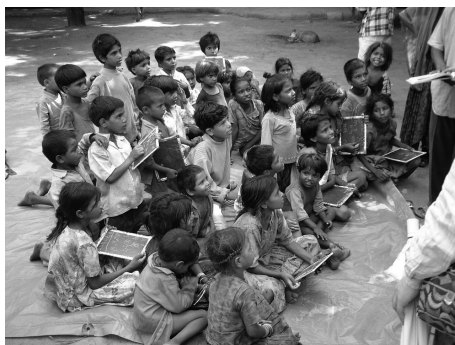
(写真5) ジャイプル Under the Bais Godam Bridge Slumの子ども達