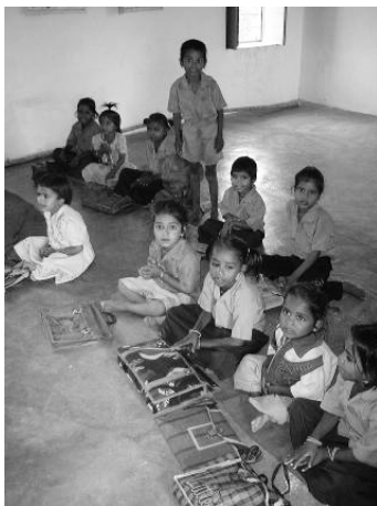
(写真1) インド、ラジャスタン州ゴーグンダにある政府立の学校