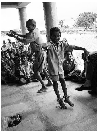
(写真2) 政府立の学校の土間、向こう側が校庭