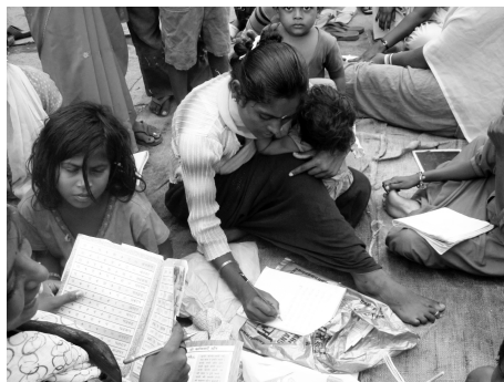
(写真4) ジャイプルのスラム内の学校で子どもに交じって読み書きを学ぶ母親