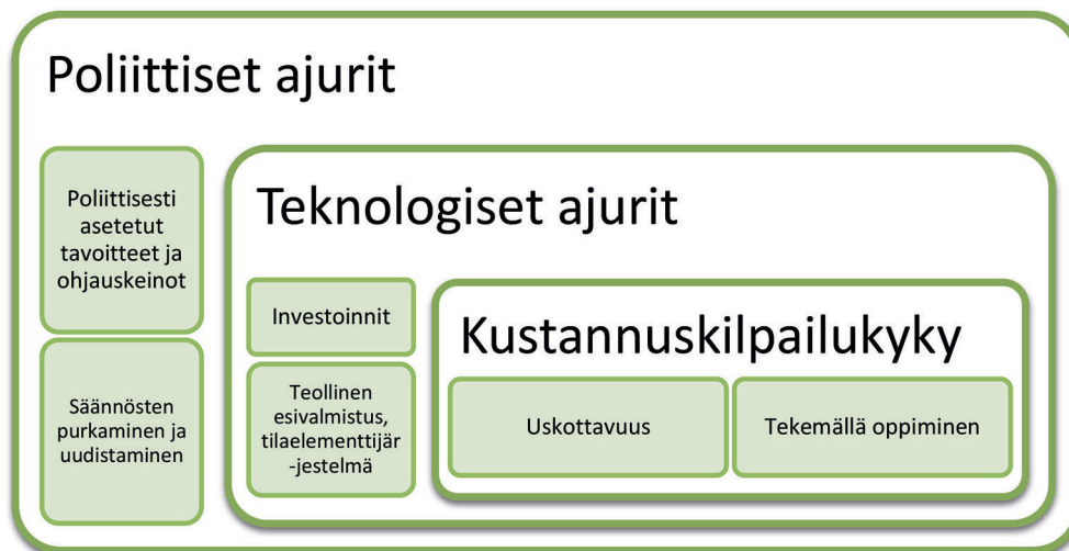
Kuva 1. Hypoteesi puukerrostalorakentamisen yleistymiseen vaikuttaneista tekijöistä.

Mediassa on liikkunut ristiriitaisia tietoja puukerrostalojen markkinaosuuden kehittymisestä. Viimeisimmän aineiston mukaan näyttää kuitenkin siltä, ettei Kataisen hallituksen tavoitetta ole lähimainkaan saavutettu – tähän asti yli kaksikerroksisten puurakenteisten asuntorakennusten markkinaosuus on jäänyt korkeimmillaan kahteen prosenttiin, joka saavutettiin vuonna 2015. Vuonna 2018 osuuden odotetaan kuitenkin nousevan jo viiteen prosenttiin (Kuva 2).