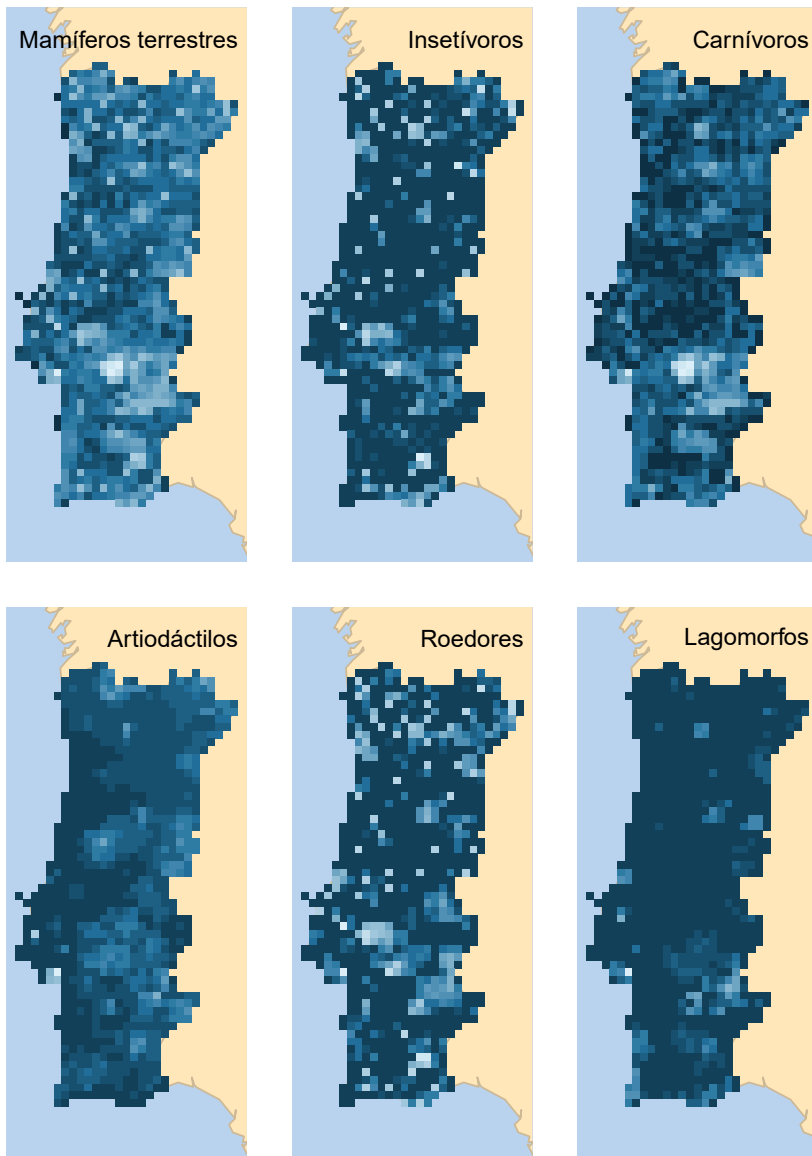
Fig. 7 - Mapas de ignorância representando a incerteza relativa ao número observado de espécies, tendo em conta o número de registos obtido para cada grupo taxonómico (Ruete, 2015), em cada quadrícula UTM de 10x10 km 2 de Portugal continental. Zonas mais escuras têm maior probabilidade de terem a sua riqueza específica subestimada, dado o baixo número de registos aí existentes para o respetivo grupo taxonómico