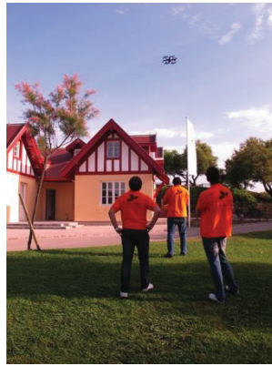
Figura 1. Vuelo con el miniDrone para toma de fotografías

Una vez decidida la metodología a emplear: mediante la captura de información a través de la toma de fotografías convergentes al edificio, se investigó el integrar nuestro sistema con la utilización de nuevos métodos de captura, así la parte de la cubierta del edificio se realizó por captura con cámara aerotransportada en un Drone cuatríhlice o UAV (Unmanned Aerial Vehicle), a partir de ahora DRONE, que se subcontrató por parte del Ayuntamiento de Santander, integrando también la utilización de un miniUAV, a partir de ahora MICRODRONE, adquirido por el Ayuntamiento de Santander para poder estudiar la generación de modelos de “bajo coste”. No encontrando, en la actualidad, publicaciones ni referencias a vuelos con un aparato tan económico y una cámara HD tan sencilla.