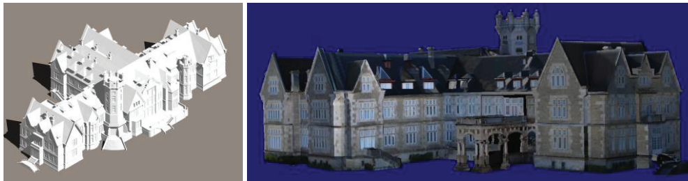
Figura 3. Modelo 3D del Palacio de la Magdalena: Modelo Geométrico y Modelo con Texturas

En este proceso lo primero es idealizar las fotografías que se vayan a utilizar, comenzando con el proceso habitual de relacionar puntos comunes hasta lograr orientar todas las fotografías. Una vez idealizadas y orientadas se hizo una superficie densa, una superficie sobre la que trabajamos, se eligió el formato DSM (Modelo de Superficies) que permite seleccionar una zona concreta común en todas las imágenes. Teniendo siempre cuidado de mantener un error residual bajo. Una vez seleccionada la zona marcamos de forma automática mediante los algoritmos de visión artificial. Para lo que sería imprescindible, contar con unas dianas que anclasen perfectamente el objeto. Esta fue la principal línea de investigación conseguir una nube de puntos para restituir y lograr un modelo preciso. Para crear esa nube se usaron técnicas de fotogrametría unidas a los algoritmos de visión artificial, después con nuestra nube de puntos triangulamos creando una malla. En nuestro trabajo llegó un momento en que se unieron todas las partes del edificio con las que trabajamos en CAD, sobre un plano de planta que sacamos del GIS del ayuntamiento. Se exporta cada una de las partes en formato DXF, al abrirlas en CAD lo primero que había que lograr era orientarlas, alinearlas en los ejes X, Y y Z y escalarlas con la planta hasta hacerlas encajar formando un solo sistema en coordenadas UTM.