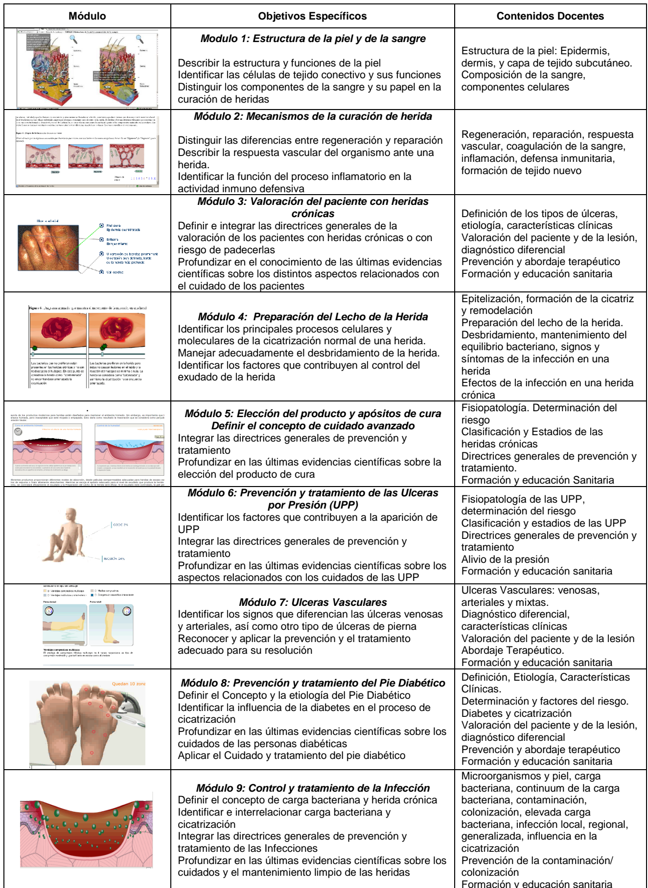
Tabla 1. Módulos de aprendizaje.

mayor uso por los profesionales de habla hispana, del sector lo cual facilita la labor del docente.