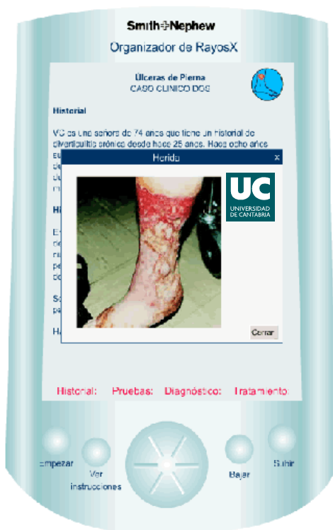
Fig. 2. Ventana de ejemplo de un caso clínico.

Estos test, de autoevaluación son útiles para que el alumno pueda valorar de una forma continua su propio aprendizaje y adelantar su ritmo o por el contrario detenerse en aquellos temas en los que se demuestra a sí mismo que tiene dificultades. Además, las respuestas de estos test están razonadas de manera automática tras ser señaladas adecuadamente por parte del alumno, dadas las facilidades de autocorrección de la plataforma WebCT-Blackboard utilizada en el desarrollo de la aplicación.