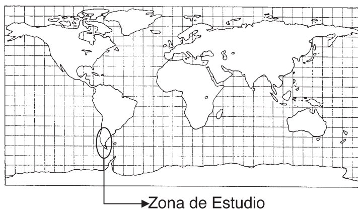
Figura 1 LOCALIZACIÓN DE LA ZONA DE ESTUDIO

Por lo tanto, la ubicación ya nos da idea de la alta latitud sur y las condiciones ambientales que la avifauna de estas zonas debe soportar.