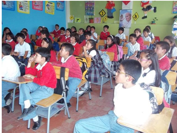
Imagen 4. Grupo de niños seleccionados para la ejecución del proyecto.

Tiempo utilizado: Cuarenta y cinco minutos por cada grupo de trabajo para el desarrollo de las tres actividades. En promedio, quince minutos para cada actividad.