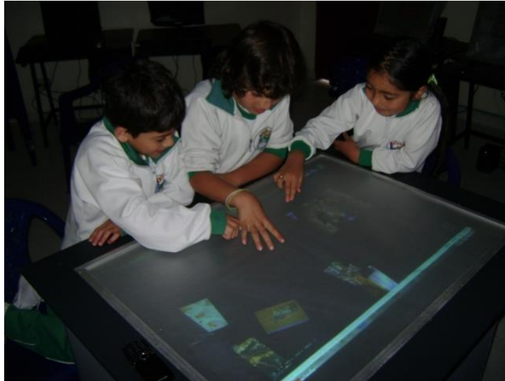
Imagen 5. Grupo de estudiantes durante las prácticas educativas.

finalizar toda la actividad el mismo programa presenta un informe con los resultados representados en puntajes de 0 a 50 puntos.