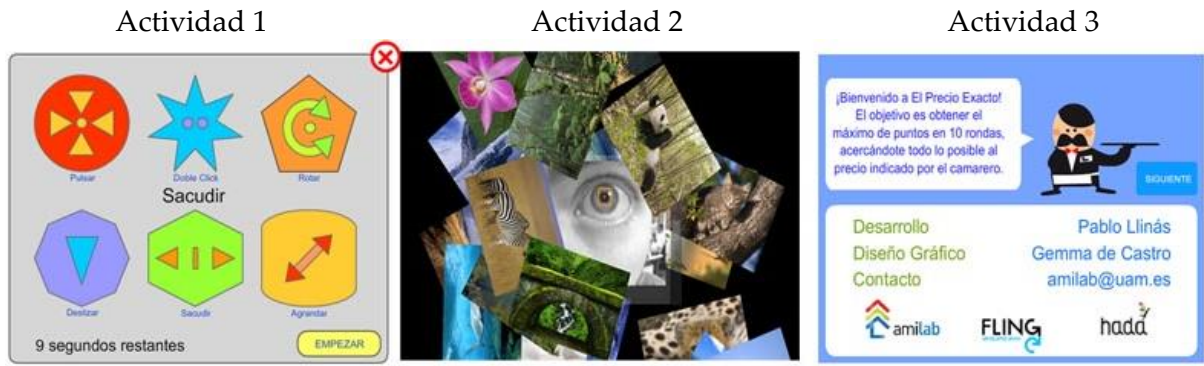
Imagen 3. Aplicaciones seleccionadas para las actividades con niños.

representado en billetes y monedas de diferente denominación. El niño debe pagar el precio tratando de usar su dinero en la forma más adecuada. Es útil para la práctica de gestos multitáctil y el desarrollo de diferentes habilidades de aprendizaje.