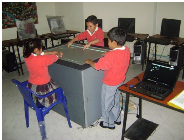
Imagen 6. Uso de una silla para mejorar la ubicación frente a la mesa.