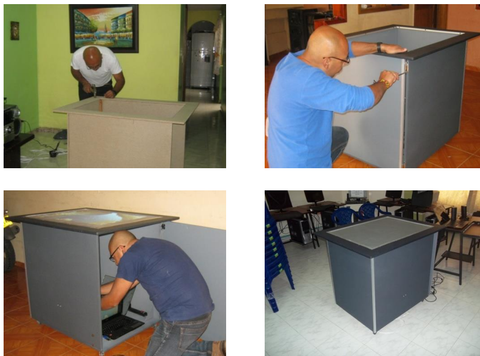
Imagen 2. Proceso de construcción de la mesa multitáctil.

1. Diseño y construcción: Como ya fue mencionado, este dispositivo fue construido en la ciudad de Pasto, seleccionando para tal propósito la tecnología RTIF (Reflexión Total Interna Frustrada). En esencia, la mesa cuenta con un proyector que envía la imagen desde abajo hacia una superficie acrílica de 8 mm de espesor ubicada en posición horizontal; además utiliza una fuente de luz infrarroja ubicada al rededor de su borde. Dicha luz se desplaza por todo el acrílico y se “frustra” al recibir el contacto de los dedos. Una cámara de video realiza la captura de la imagen que contiene los puntos de contacto, dicha imagen es procesada por un software especializado que hace la interpretación de las sucesivas capturas de una cámara de video y filtra dichas capturas hasta obtener una imagen nítida de los puntos de contacto de los dedos con la superficie, estas imágenes son interpretadas por el software que reacciona ante las órdenes recibidas por parte del usuario.