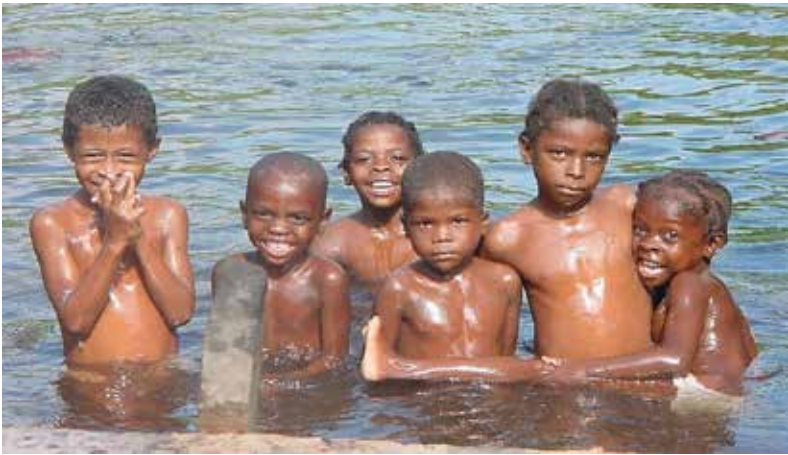
Fotografía 2. Gente entintada de la Costa Pacífica.

En los años 80 llegó la bonanza del camarón, en la cual se invirtió mucho dinero; alguno, según dicen, de origen caliente; nuevamente el campesino fue desalojado de sus tierras, esta vez por la presión del dinero; mira, aquí, en 1981, una hectárea de tierra valía quince mil pesos o menos y nadie la compraba; hoy la misma hectárea vale más de dos millones de pesos y ya casi no hay.