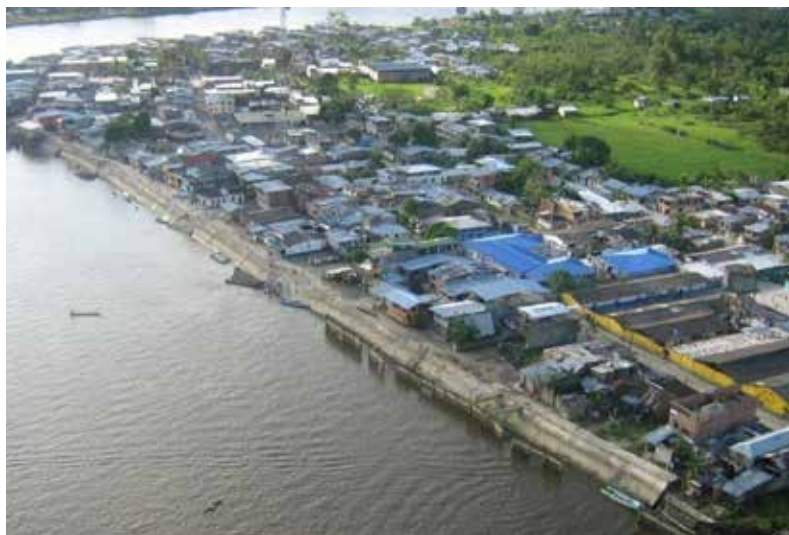
Fotografía 32. Vista aérea, muralla de protección, municipio de El Charco. 2009.

Cuando llegamos a Pasto, lo primero que hicimos fue trasladarnos al Inderena; cuando llegamos a este Instituto, el Secretario nos atendió muy amablemente y después de explicarnos qué funciones tenía que cumplir el Inderena, nos envió también con mucha amabilidad al HIMAT; al llegar nos recibió el señor Director y nos dijo que el HIMAT era un Instituto del orden nacional, que su tarea principal era el