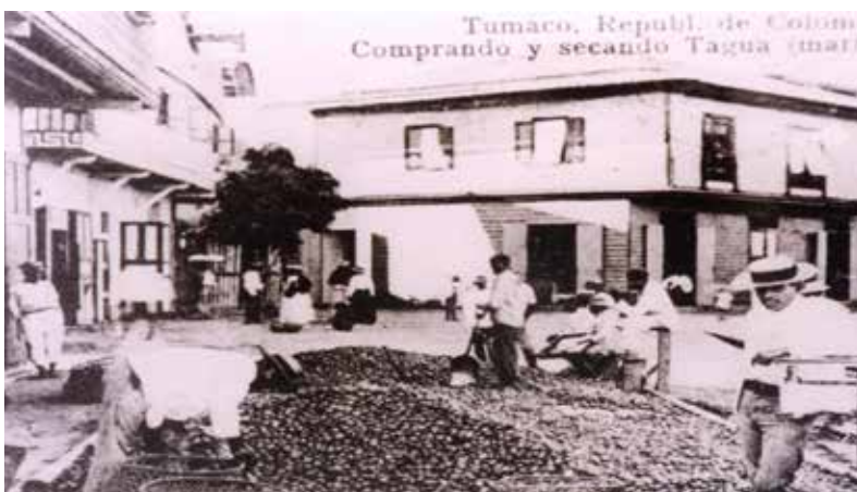
Fotografía 17. Venta de tagua, comienzos del siglo XX. Tumaco.