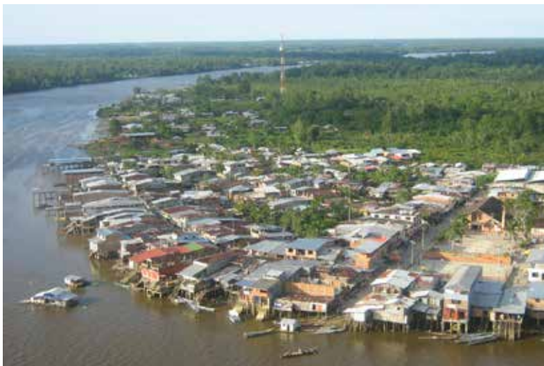
Fotografía 8. Vista aérea del casco urbano del municipio de El Charco, 2009.

La calle principal de El Charco prácticamente desapareció; las demás viviendas fueron absorbidas por la arena; las personas, heridas por su propia vivienda, se quejaban, se oían gritos de desespero solicitando auxilio; me acerqué a una de las casas contiguas y empecé a auxiliar a una señora, que el techo se habría desprendido y una de sus pesadas vigas, al caerle en una pierna, se le había fracturado; como era domingo, muchos médicos y enfermeras o estaban en las mismas circunstancias o se habían desplazado a Cali o Tumaco; nos tocó, a nosotros mismos, brindarles los primeros auxilios.