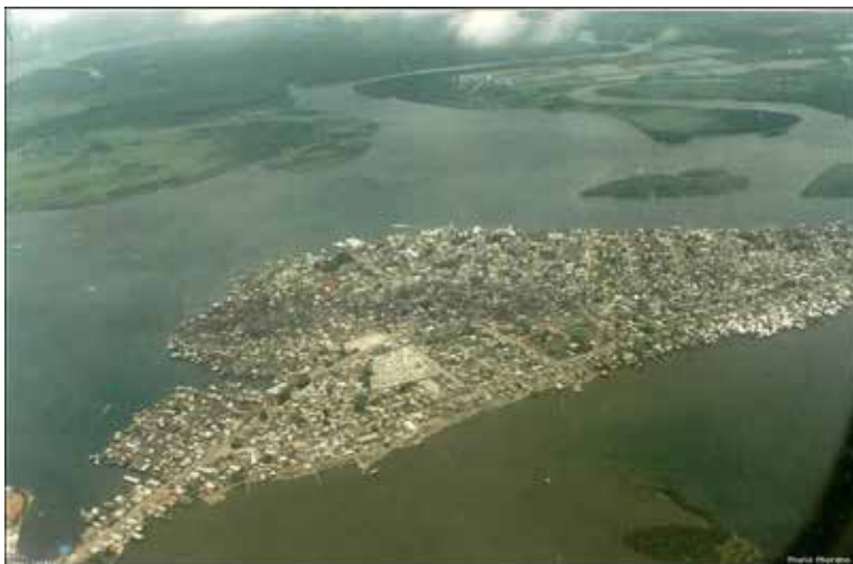
Fotografía 6. Vista aérea de la Isla de Tumaco, 2008.