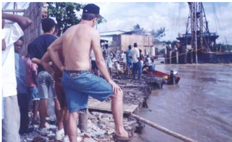
Fotografía 29, dragando el malecón por efectos del canal Naranjo, Satinga.