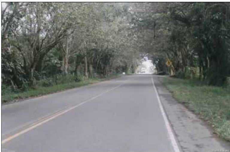
Fotografía 7. Carretera al mar, vía Tumaco, 2009.