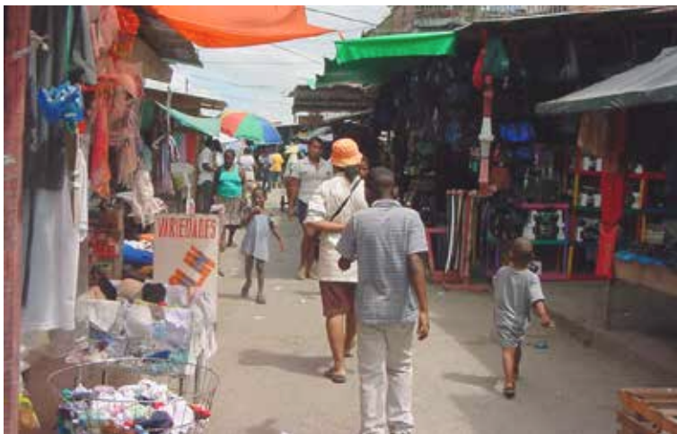
Fotografía 28. Calle central Satinga. 2005.

Hace unos veinte años, los aserraderos grandes de la costa estaban situados en Salahonda y Tumaco; para esa época había más de 35 aserraderos; entre ellos, Chapas de Nariño que era un verdadero emporio, pues ellos no sólo cortaban la madera sino que la procesaban: hacían triplex, puertas, postes, pisos etc., además exportaban a Estados Unidos y Europa; el puerto maderero para entonces, era Salahonda y Tumaco, y la madera se cortaba por el Patía Viejo y era transportada por el río, en largas jornadas, hasta llegar a estos dos puertos de Nariño y desde allí se embarcaba, en trozas, hacia Buenaventura; en este puerto es donde la mayoría de los dueños de aserraderos tienen sus propias bodegas de donde se envía la madera, en tablas, hacia el interior del país.