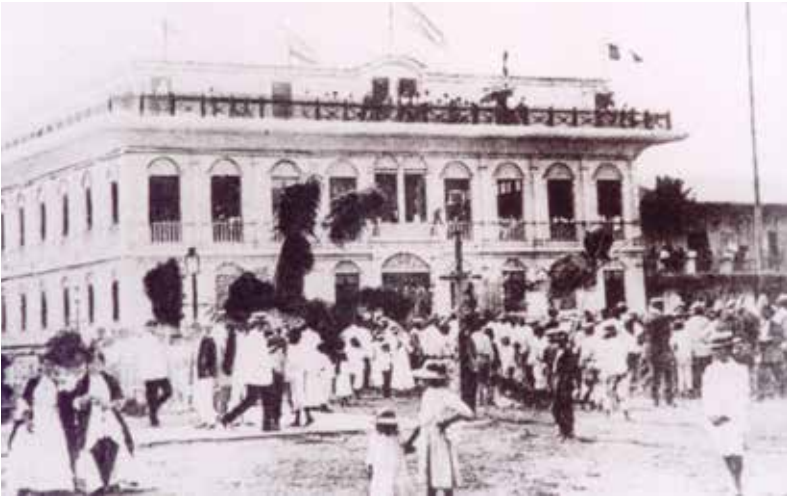
Fotografía 19. Antigua alcaldía del municipio de Tumaco