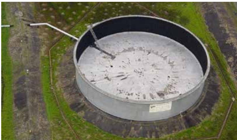
Fotografía 13. Tanque de petróleo a las afueras de Tumaco, 2009.

de minas y energía el doctor Miguel Ángel Urrutia Montoya, decía: “Considero que sólo en 1980 se podría comenzar a importar la maquinaria que se requiere para una instalación de las características de la Refinería de Occidente 24 ”.