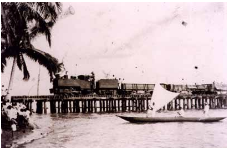
Fotografía 16. Llegada del tren del Pacífico a Tumaco, a mediados del siglo XX.