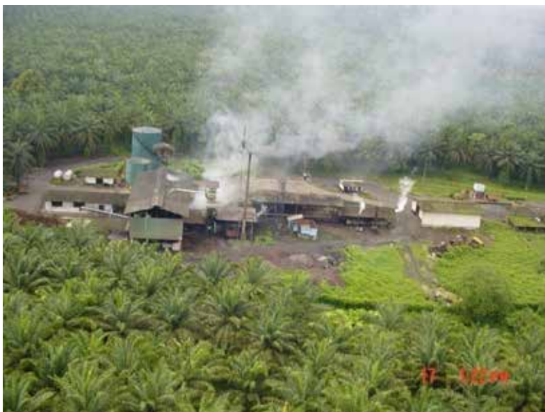
Fotografía 15. Planta de procesamiento de palma africana, Astorga.

Como yo era la persona responsable de la Junta Cívica, porque era su presidente, entablamos una demanda contra Ecopetrol, hicimos una inspección a las instalaciones del terminal del Oleoducto de Tumaco y comprobamos que no existía una zona especial para capturar los residuos y para el tratamiento de éstos ni se había montado una planta que permitiera evacuar los residuos sin causar perjuicios graves al manglar y a las playas y, ante todo, a sus aves y, sobre todo, por lo frágil de la ubicación del terminal del oleoducto, que es una zona de gran influencia ecológica por cuanto está en plena zona de manglar.