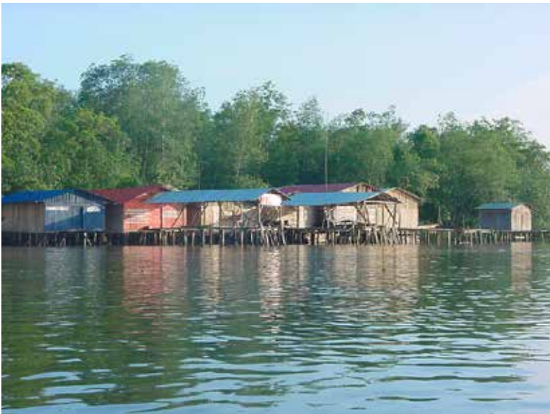
Fotografía 13. Palafitos, municipio de Francisco Pizarro