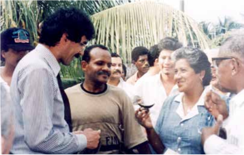
Fotografía 10. El ex ministro de salud Camilo González, dialogando con Lico Biojón y demás dirigencia cívica de Tumaco.