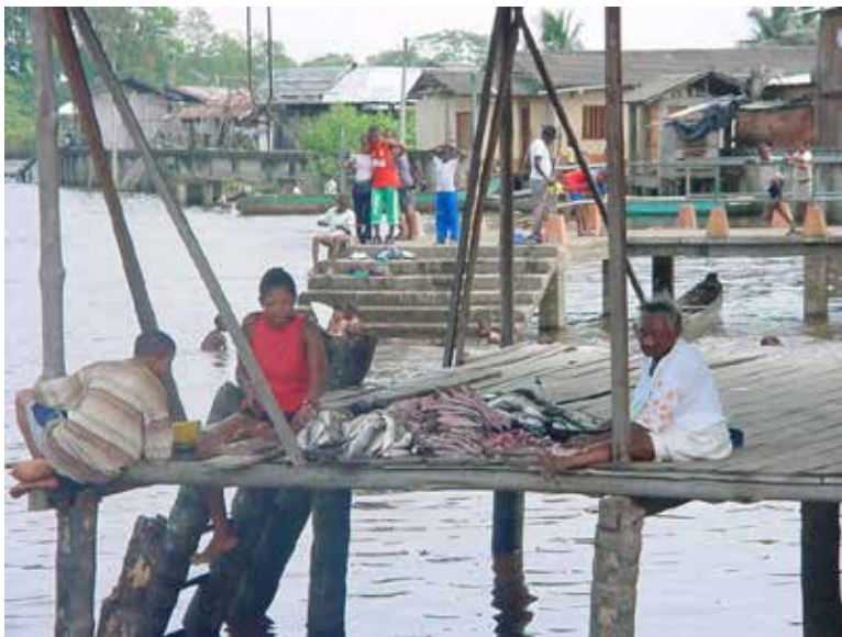
Fotografía 27. Puerto de Salahonda. 2009.

Desde tiempos de la Colonia, los españoles daban como recompensa a los conquistadores la explotación del oro, ostras (perlas preciosas) y la madera como recompensa por venir a reducir las tribus indígenas que poblaban la costa 60 ; en los tiempos modernos, el Gobierno, por diferentes leyes y especialmente después de las guerras civiles del siglo XIX, siguió guardando este criterio; a los coroneles de cada guerra se los recompensaba con tierras baldías, cuando eran en realidad, como con los Sindaguas, tierras que pertenecían a los indios, a los blancos y a los negros de la costa.