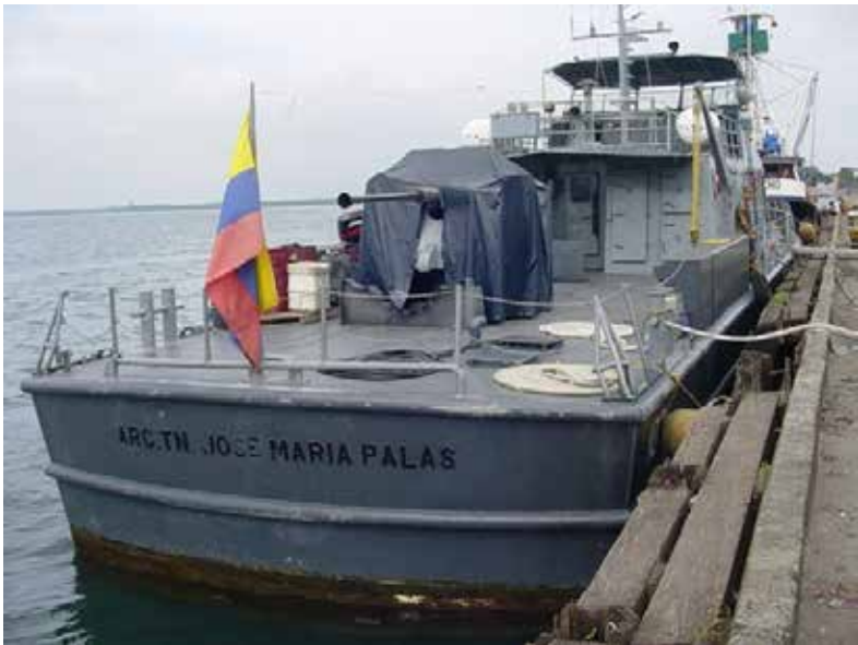
Fotografía 14. Buque de la armada, fondeado en el puerto de Tumaco, 2008.

Como consecuencia del derrame, hubo un desastre ecológico grandísimo, que jamás se cuantificó; las aves marinas también sufrieron contaminación porque las aves se desarrollan en torno al mar y a las playas, pelícano, gaviota, piura, etc., hay una cantidad de aves que nosotros conocemos muy poco, pero la gente estudiosa de ese campo de la ecología