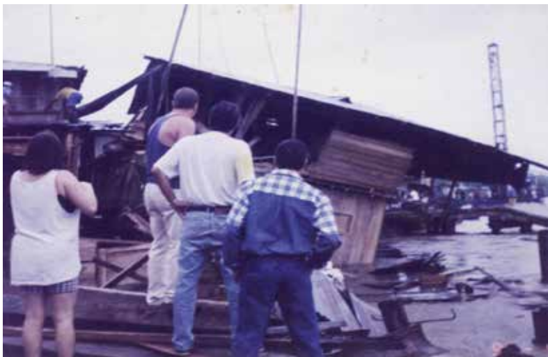
Fotografía 30. Efectos del canal Naranjo, en el casco urbano de Satinga.