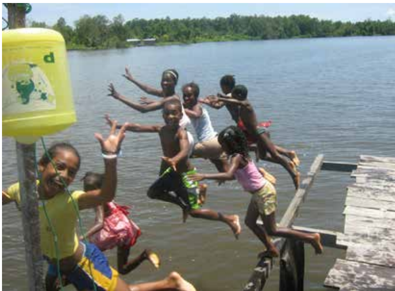
Fotografía 31. Niños jugando en el río Patía. 2009.