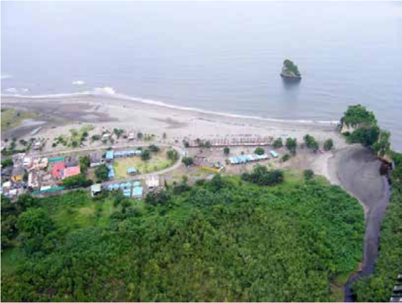
Fotografía 5. Vista aérea, Isla del Morro, 2008.