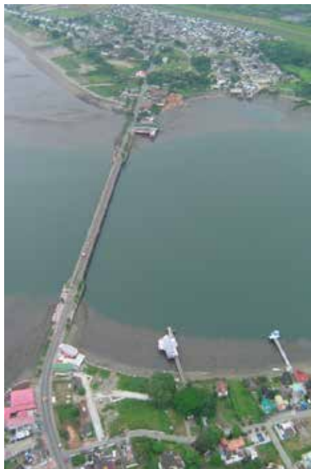
Fotografía 20. Vista aérea del puente de El Morro. 2009.