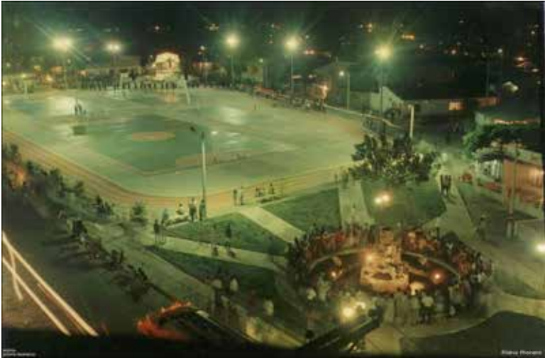
Fotografía 23. Vista nocturna cancha de San Judas. Tumaco, 2009.

Los tanques, durante toda la noche, recorrieron las polvorientas y calurosas calles del puerto, haciendo recordar que estaban en Toque de Queda; como las viviendas son casuchas de madera, muchas de ellas de desecho de los aserraderos, pasaba un cascabel y temblaba toda la cuadra, y la gente asustada porque eso les hacía recordar los temblores y terremotos que periódicamente sacuden a la costa; lo que la gente y nosotros no sabíamos era que este temblor iba a tener una mayor intensidad que cualquiera de los anteriores realizados por la naturaleza; este era un temblor social sin precedentes, la respuesta de un pueblo construido en tres islas y que ahora era una sola.