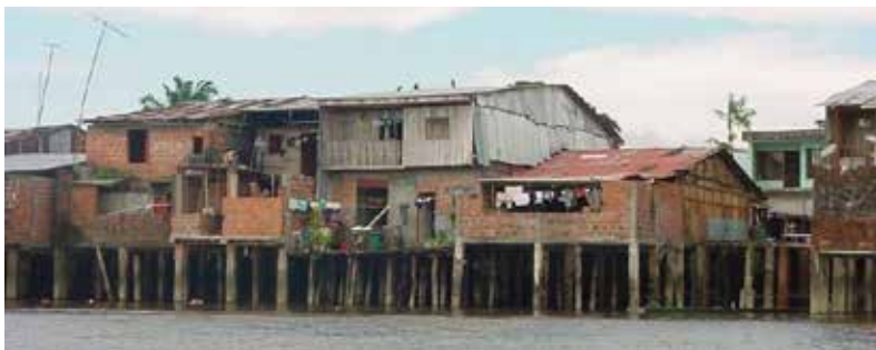
Fotografía 25. Palafitos, municipio de El Charco. 2009.

Antes de llegar los negros y españoles a esta región, habitaban los indios Chapanchicas, los Iscuandé y Guapis, cuyo cacique Omoco no opuso mayor resistencia 57 , y, por lo tanto, se asentaron tempranamente en la costa norte del Departamento de Nariño; desde entonces se explota el oro en Iscuandé; los españoles tuvieron noticias de que en esta costa se podía fundar minas en esas primeras exploraciones.