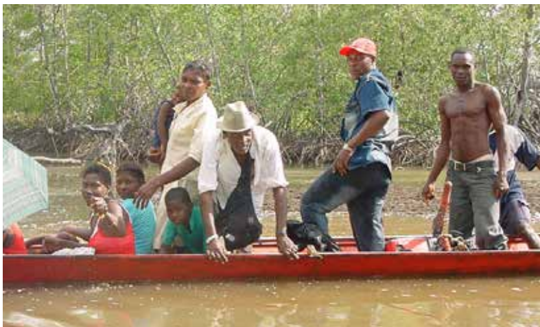
Fotografía 1. Agua, canoa y hombre, medio de transporte en la costa Pacífica.

“Mira, con todo el oro que se ha sacado de Barbacoas, Iscuandé, Payán y Maguí, era para que las poblaciones costeras tuviéramos hace años de todo y eso no ha sido así; el oro ha sido nuestra desgracia y nuestra fortuna, o si no nosotros, los negros, no estaríamos hoy aquí relatando nuestra propia historia