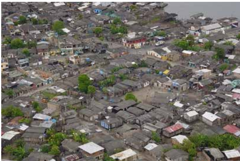
Fotografía 4. Vista aérea de la Isla de Tumaco, 2008.

Entonces, con la creación de una Junta cívica íbamos a tener una vocería legítima y reconocida; para entonces el civismo se lo miraba como una actividad marginal y muchas veces desde la ilegalidad; en cambio, en ese sentido podríamos entrar a encuadrarnos dentro del marco legal de la protesta, sin visos egoístas o partidistas; lo importante de este enfoque es que primaría lo colectivo y no lo personal.