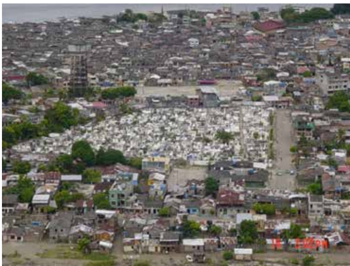
Fotografía 24. Vista aérea de la cancha de San Judas. Tumaco, 2009.

Lo que hizo ese “nicho” a las cinco de la tarde fue profanar el sitio donde realmente se gobernaba a la costa de Nariño.