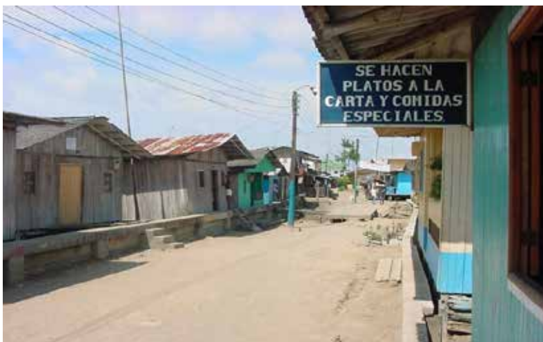
Fotografía 21. Calle de Salahonda, municipio de Francisco Pizarro. 2008.