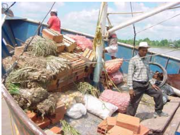
Fotografía 26. Campesinos rumbo a Satinga.

Antes de 1975, todo el sector del Patía Viejo y del Sanquianga éramos agricultores y salíamos a Satinga y al Charco a vender nuestros productos, los cuales los intercambiábamos por carne serrana y demás productos que no había en la región; el campesino, aunque pobre, comía lo poco que producía el suelo, y para complementar cazábamos, que es otra fuente de alimentación abundante: el venado, la tatabra, el conejo de monte.