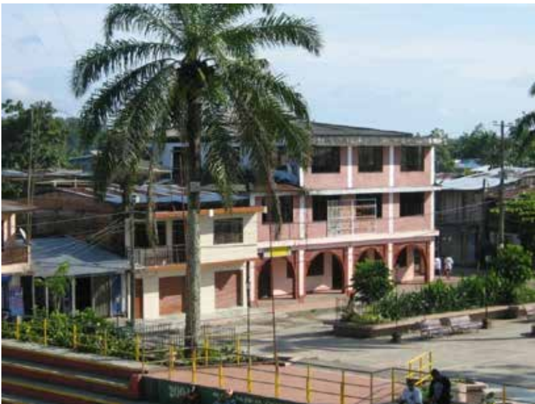
Fotografía 9. Alcaldía del municipio de El Charco, 2009.

Más adelante, había desaparecido el campanario de la iglesia, lo mismo que la estructura del hospital y de la Casa Municipal; en las veredas de Amarales, Vigía y Mulatos, cerca a la bocana del río Tapaje, se había hundido en la arena; el mar había nuevamente avanzado sobre el continente; caminaban sin rumbo sobre la inmensidad de la playa, con algunas de sus pertenencias en las manos o sobre la cabeza; las mujeres, con sus hijos sobre el brazo, miraban el suelo y la