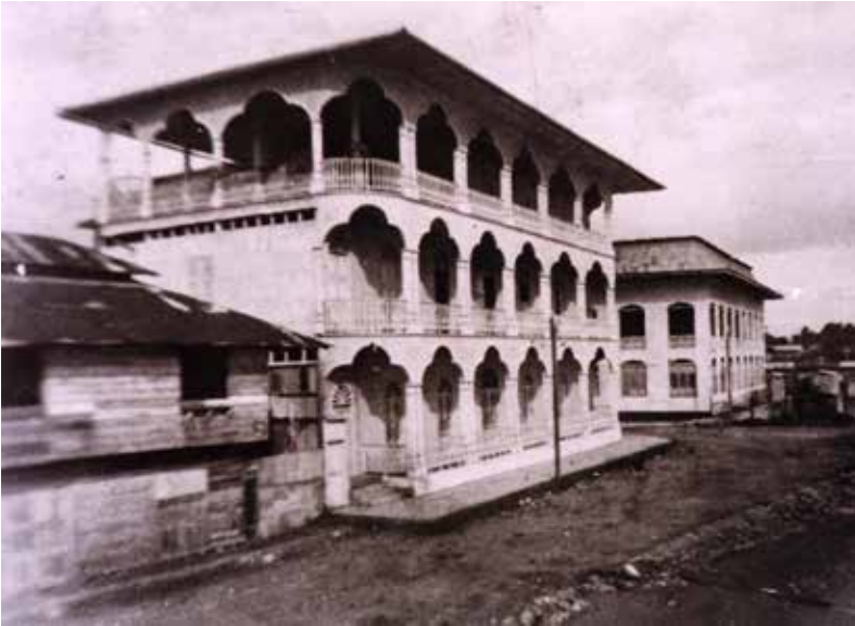
Fotografía 18. Residencia a comienzos del siglo XX, con fuerte influencia árabe, Tumaco.