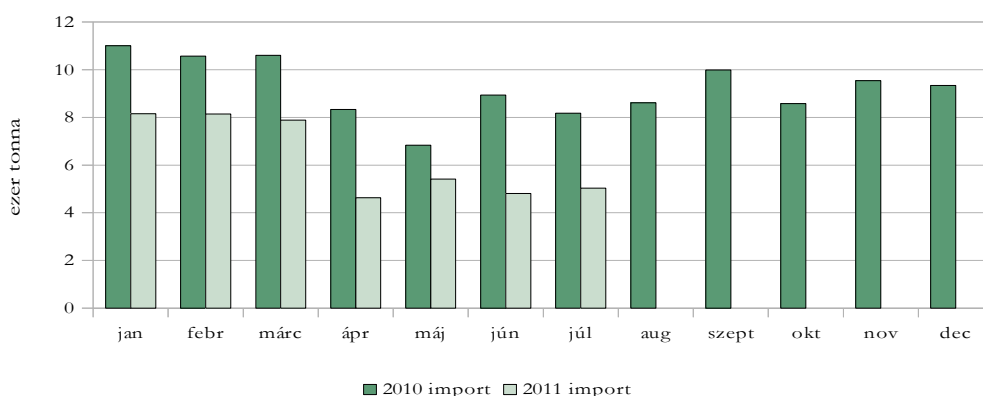
Az élő sertés behozatalának alakulása 2010. és 2011. I-VII. hónapjában

Az olajos magvak 175 ezer eurós egyenlege 2011 első hét hónapjában 20%-kal romlott a bázis időszakhoz képest, miután az export 8%-kal csökkent és az import 61%-kal emelkedett. A napraforgó és a repce kivitele visszaesett, behozatala ellenben jelentősen emelkedett.