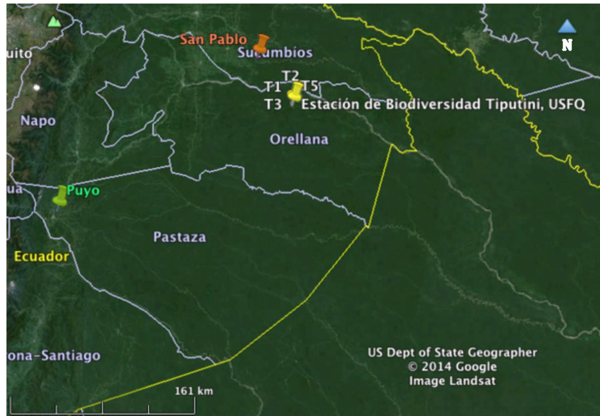
Figura 1. Mapa de distribución de las tres poblaciones de Callithrix pygmaea en estudio (San Pablo, Tiputini (4 grupos – T1, T2, T3, T5) y Puyo).

(Mapa generado en el programa Google earth ® derechos reservados 2014)