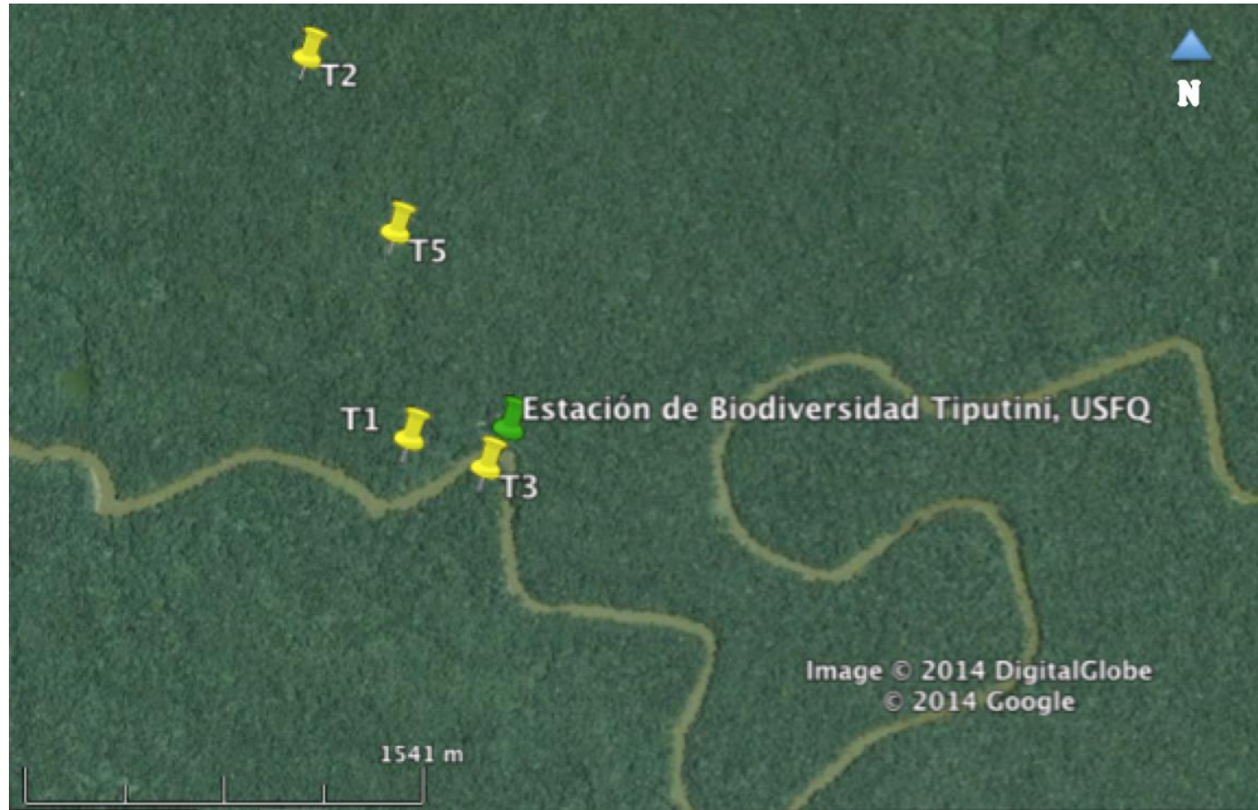
Figura 2. Mapa de las poblaciones de Tiputini: T1, T2, T3 y T5.

(Mapa generado en el programa Google earth ® derechos reservados 2014)