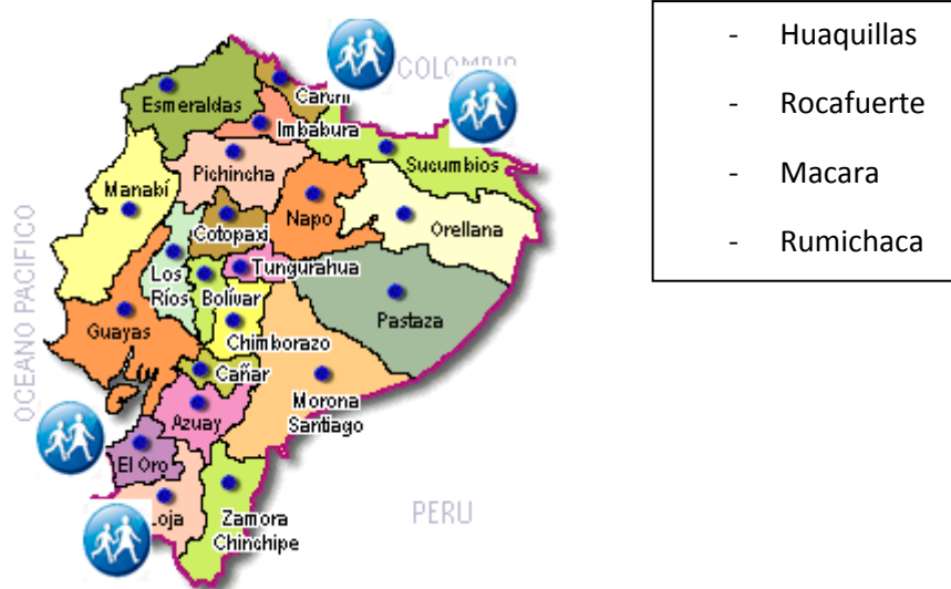
Ilustración 1: Puestos fronterizos terrestres

De igual manera a continuación, se detallara los distintos lugares que pueden servir como accesos y que constan legalmente constituidos y autorizados para hacer migración en los distintos puestos, aeropuertos y puertos fronterizos para personas extranjeras que desean ingresar al Ecuador.