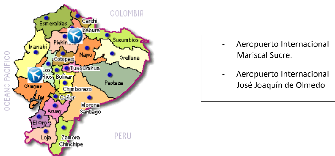
Ilustración 3: Aeropuertos Internacionales