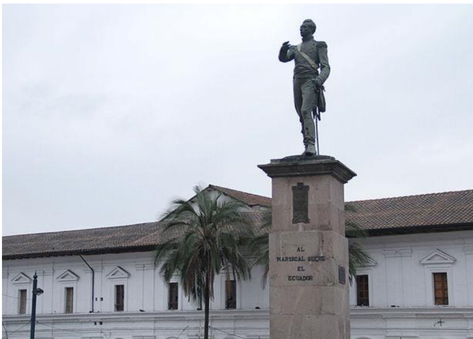
IMAGEN 3 VISTA FRONTAL DEL MONUMENTO