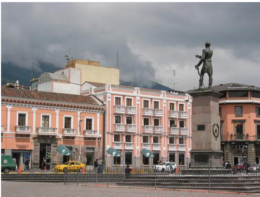
IMAGEN 4 VISTA POSTERIOR DEL MONUMENTO, SEÑALANDO A LAS FALDAS DEL PICHINCHA

Municipalidad en este contexto, con el propósito de “revelar que no se ha extinguido el genio artístico de los quiteños principalmente” 44 .