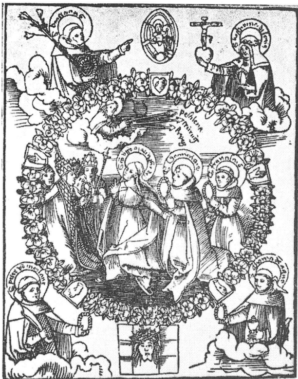
La Virgen intercesora, Xilografía alemana (Trnsición del siglo XV al XVI)