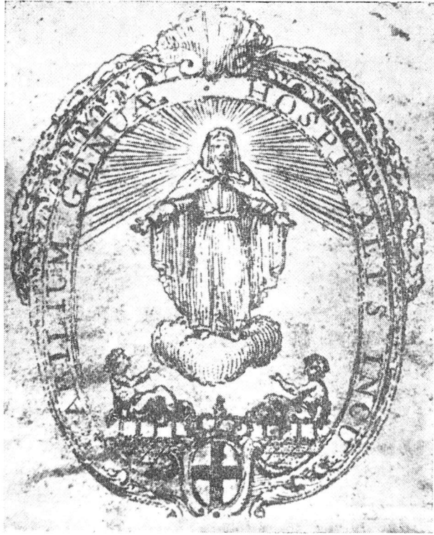
Virgen del Manto en el sello del Hospital de Incurables de Génova (siglo XVI)