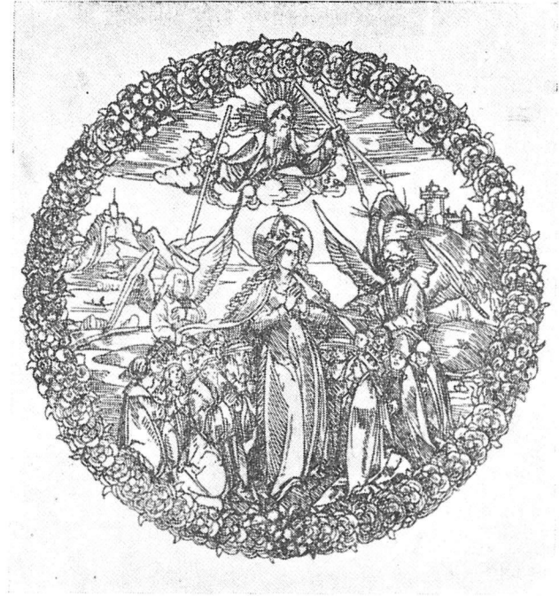
Xilografía alemana con la Virgen del Manto (Transición del siglo XV al XVI)