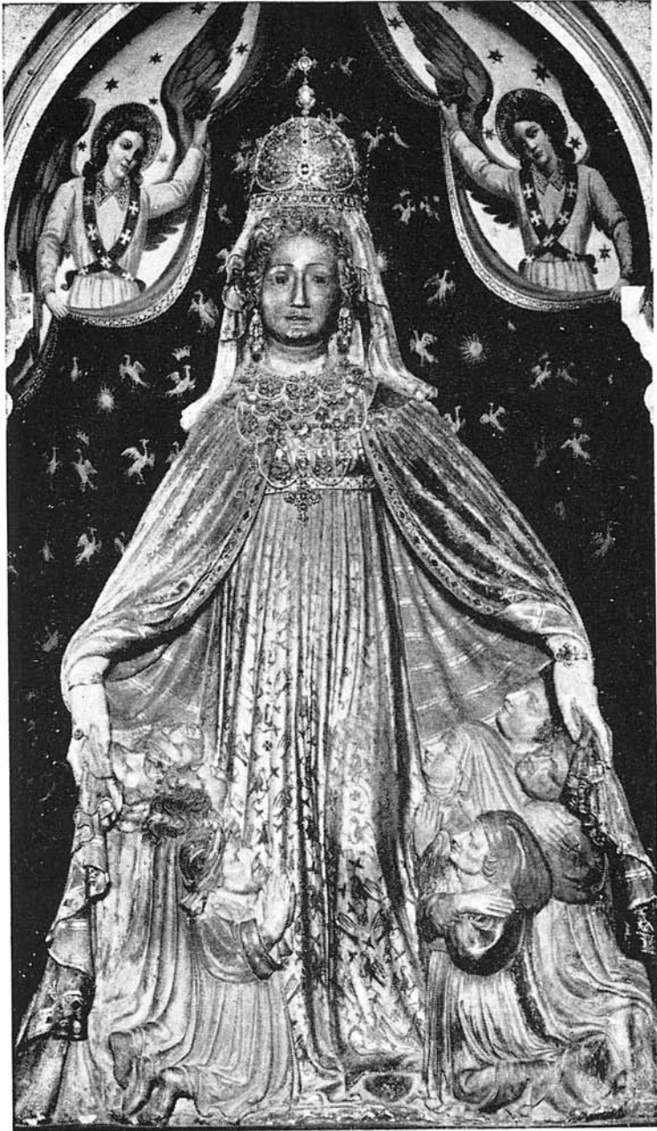
Virgen del Manto de Monte Bérico, patrona de Vicenza (siglo XV)