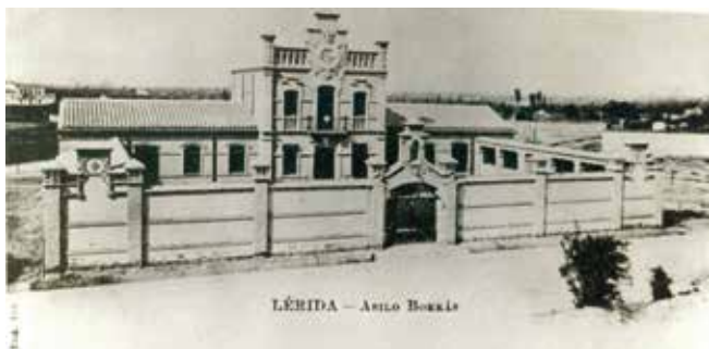
Fig.4. Vista de l'Asil Borràs, actualment plaça Pau Casals.