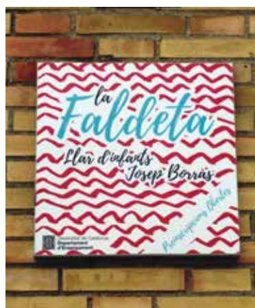
Fig.5. Placa de l'actual escola bressol Josep Borràs situada al carrer Camp de Mart de Lleida.

Quant al record, puc dir, amb complaença, que encara sobreviuen dos edificis emblemàtics, després de 152 anys de la mort d'en Josep Borràs. Un és encara present al cementiri, el seu