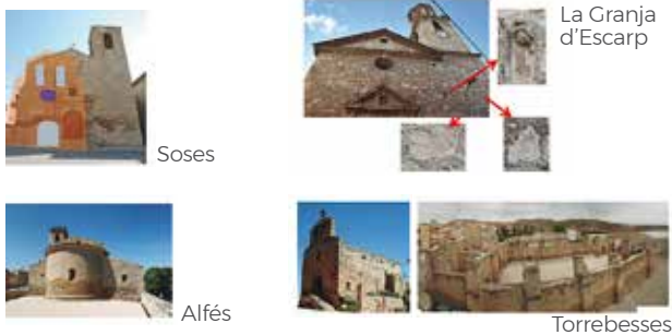
Fig. 2. Exemples interessants de les esglésies del Segrià: el "desconegut" romànic d'Alfés, l'amagada façana de Soses, restes gòtiques a la façana de la Granja i el cas singular de Torrebesses: manteniment del de sempre / projecte nou interromput. (Arqueologia Diputació / www.torrebesses).

Església de Sant Pere, que conserva l'estructura característica del romànic tardà, especialment a l'absis semicircular i la porta d'entrada. Té les habituals capelles que amplien l'espai religiós i un robust campanar situat de forma atípica sobre l'accés meridional, amb rellotge i pis per les campanes també de planta quadrada amb els angles corbats.