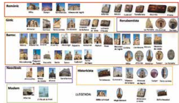
Fig. 1. Panorama diacrònic de les esglésies parroquials del Segrià classificades per estil i estat de conservació (IEI).

el temple fan que sigui una mena de far que serveix de referència per un ampli entorn que va més enllà del propi poble. En aquest sentit, al Segrià tenim dos magnífics exemples: l'església de Santa Maria d'Almenar i la Seu Vella de Lleida.