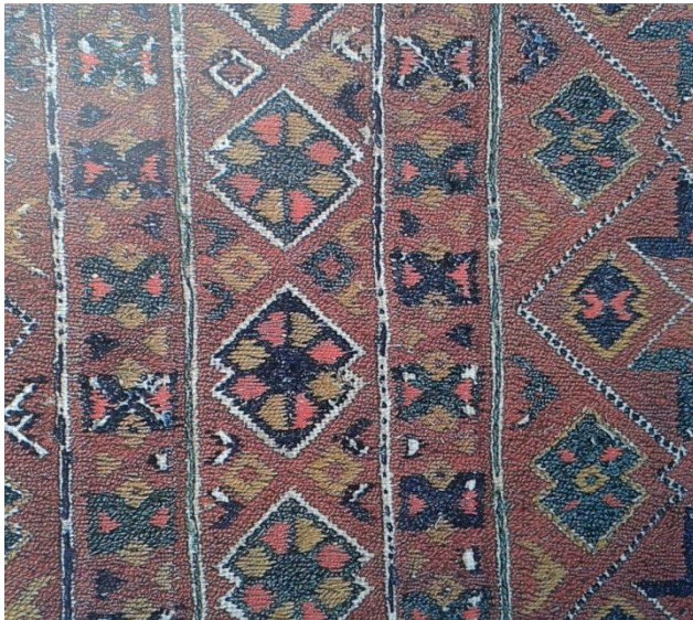
Sl. 1. Tkanina od konoplje površinski pokrivena svilenim i vunenim nitima, Južna Makedonija, 400 g. pr. Kr., [1] str. 35

Prvi dokaz tkalačkih strojeva s kamenim utezima u povijesti iz doba 6000 g. pr. Kr. su nađeni u Mađarskoj [1].