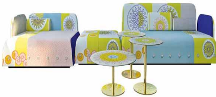
Sl. 2. Naslov članka: Modern vintage furniture (Moderan vintage namještaj), slika s portala decor4all (19.8.2010)

prostoriji s malo danjeg svjetla koristiti svjetlije boje, a presvlake moraju biti usklađene s ostalim bojama namještaja. Odabirom teksture postiže se određeni vizualni, ali i taktilni 2 dojam, na primjer mekoća ili dojam luksuza. Uzorak tkanine predstavlja vizualni raspored elemenata i motiva na površini. Uzorak može biti rezultat strukture vlakna ili može biti otisnut na površini. Uzorak bi trebao biti usklađen s ostalim elementima u prostoriji te s veličinom prostora. Veliki uzorci s pokretom obično izgledaju dobro na prozorima, međutim nisu uvijek najbolji odabir za tapecirani namještaj [2] .