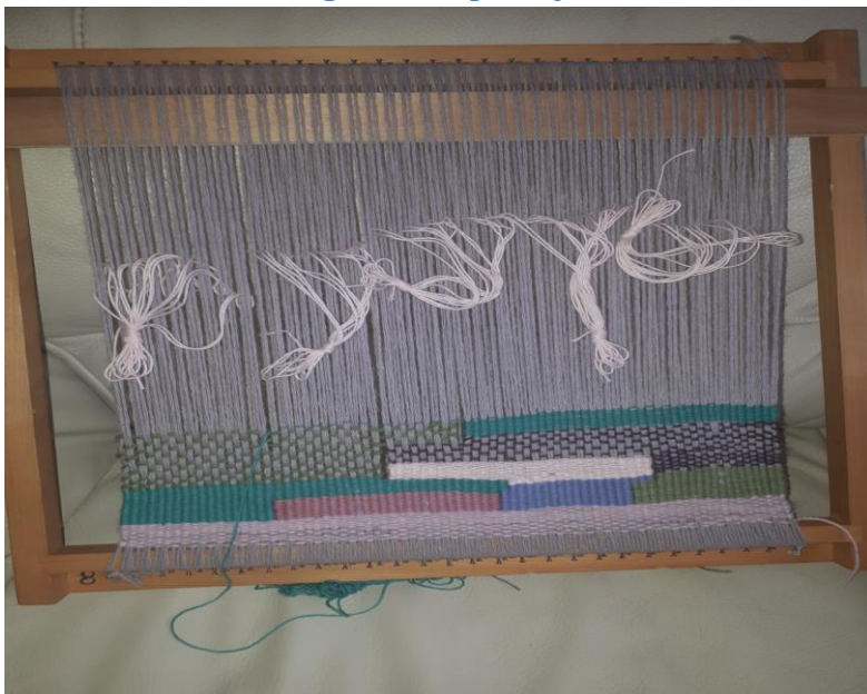
Slika 6. Izrada tapiserije