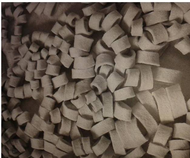
Sl. 10. the art of felt , autorica: Françoise Tellier-Loumagne (10.8. Gradska knjižnica, Starčevićev trg)

Filcanje je tehnika prerade vune koja se temelji na svojstvu vlakana da se uslijed mehaničkog i toplinskog djelovanja upletu u čvrstu strukturu. Vuna se nakon češljanja ne prede u nit, nego se moči vodom i sapunom, a zatim gnječi i valja. Na kraju se dobije gust i neraskidiv materijal - filc. Svojstva filca su toplinska i zvučna izolacija, teško je poderiv i može se precizno rezati. Dizajnerica i umjetnica Françoise Tellier-Loumagne istražuje dekorativni potencijal ovog praktičnog netkanog tekstila, a inspiraciju pronalazi u oblacima, zalascima sunca i nebu koje se stalno mijenja kako bi izradila originalne prostirke, tepihe ili sjenila za lampe. U knjizi the art of felt (Umjetnost filca) dizajnerica detaljno navodi uz svaku sliku tehniku izrade pojedinog predmeta pri čemu joj nebo i njegove promjene službe kao inspiracija [3].