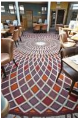
Sl. 4. hotel Admiral Collingwood (24.7.2015.)

Tepisi izrađeni Wilton tkanjem jako su otporni na habanje te se zbog toga upotrebljavaju u frekventnim prostorima. Axminster procesi tkanja koriste se za proizvodnju tepiha s uzorkom. Imaju veći broj boja od Wilton tepiha. Koriste se u luksuznim prostorima kao što su hoteli.