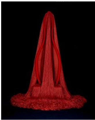
Sl. 5. skulptura Red Preview (Crveni pregled) koju je Zeisler izradila 1969. (Wikipedia 11.8.)

dekoracije. Usporedno s podizanjem srednjovjekovnih burgova i kaštela, a od renesanse i dvoraca, potražnja za tapiserijama neprestano je rasla. Njima su se prekrivale zidne plohe, ali i kreveti, sjedala, vladarska prijestolja, vješale su se na prozore, vrata, oko kreveta [4]. Između dva svjetska rata tkalci tapiserija doveli su u pitanje podjelu na lijepe umjetnosti i tekstil. Nakon Drugog svjetskog rata bilo je puno tapiserija umjetničkog dizajna (Matisse, Miró, Picasso). Iako su slike ključne za tkalce tapiserije, uz vlakna i boje također je postao važan i oblik [1]. Tako su nastale ambijentalne skulpture tapiserije Claire Zeisler.