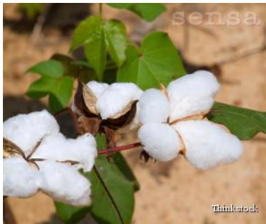
Slika 11. Plantaža pamuka (izvor: http://www.sensaklub.hr/clanci/zeleni-savjeti/fairtrade-postovanje-ljudskih-prava?page=2 ) od 20.8.

Pravedna trgovina naročito je važna u tekstilnoj industriji jer se većina tekstila proizvodi u siromašnim zemljama zbog vrlo niskih troškova proizvodnje, odnosno jeftine radne snage. Osim toga, na plantažama pamuka poštuje se zaštita okoliša pa je sigurno da dobivena tkanina ne sadrži nedopuštene pesticide. Dakle, za cijenu koju plaća Fairtrade traži i određenu kvalitetu.