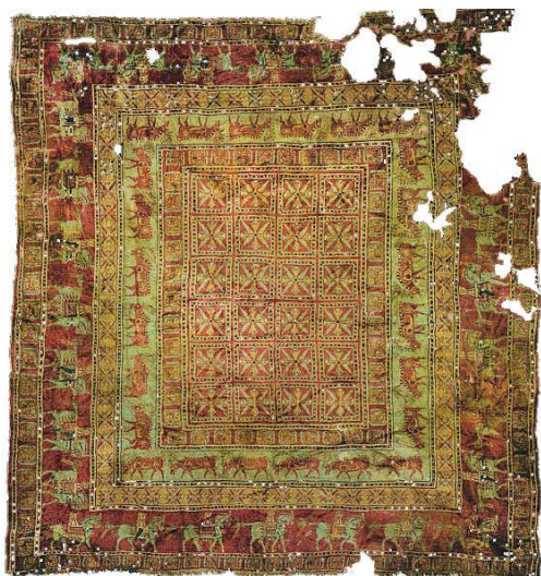
Sl. 3. Tepih od meke vune u Pazyryku [1] 58.str.

Tepisi koji se izrađuju za komercijalnu uporabu moraju biti izdržljivi, gusti, niske flore, od poliamidnog vlakna. Dok tepih u kući osigurava toplu i ugodnu atmosferu, tepisi u poslovnim zgradama šalju određenu poruku o kompaniji. Osim toga, tepih služi i kao toplinska i akustička izolacija, koji su u skladu sa standardima. Tako u Europskoj uniji od 2007. godine prodaja tepiha mora ispunjavati zahtjeve u pogledu zdravlja, sigurnosti i štednje energije propisane Direktivom o građevinskim proizvodima.