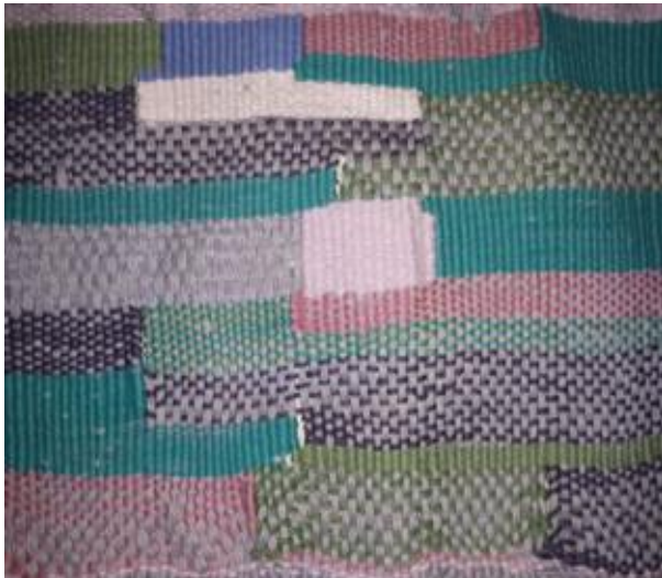
Slika 7. Dovršena tapiserija

Za svoj završni rad koristila sam tkalački okvir kakav se koristi za izradu tapiserija i zidnih ukrasa. Okvir se inače izrađuje od letvica/borovina, a na uglovima se učvrsti s vijcima. Čavlići u gornjoj i donjoj letvici moraju biti točno u liniji te se na zabijene čavlice nasnuju osnovine niti. Potka se pribija drvenim češljem ili ručno. Kako tkana površina ne bi bila jednolična, umeću se različite boje, tvore se motivi kako bi se dobila tapiserija ili zidni ukras.