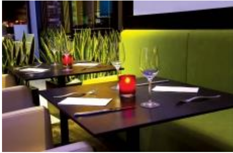
Sl.9. Pametni tekstil za tapeciranje namještaja