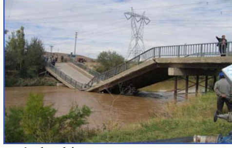
Resim 1. Yıkılan Peçenek Köprüsü'nden bir görüntü