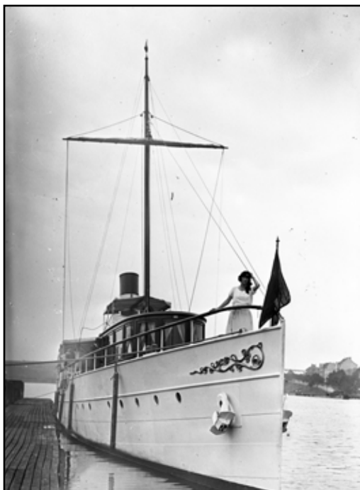
3. El iot Catalònia fotografiat per l'artista Oleguer Junyent, 1921(?).

El primer viatge l'efectuà el mateix any 1921 després d'una necessària restauració i de la contractació del capità i la tripulació, alemanys tots ells. El realitzà pel Bàltic amb la voluntat de conèixer Sant Petersburg, objectiu que no li permeten les autoritats soviètiques, i visità Finlàndia i Suècia. Des d'Estocolm es dirigeix per terra fins a Bregen on l'espera el seu amic Oleguer Junyent i on ha d'aturar el viatge en saber que ha estat proposat com a ministre de finances espanyol del govern d'Antoni Maura. El Catalònia continua la ruta prevista, sense ell, i conclou la travessa a París on es duran a terme treballs de "decoració interior per mà experta i cançonera" 8 . Malgrat la restauració duta a terme, durant aquell primer viatge els motors tingueren algunes avaries.