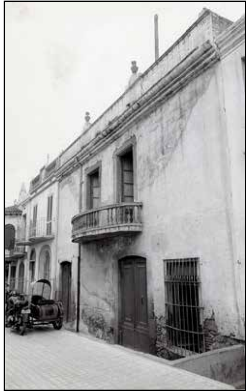
2. L'anomenada casa Cambó al carrer de Sant Jaume de Vilassar, cap al 1970.

El vaixell no recalà mai a Barcelona i segons Cambó això fou un error. El desconeixement va donar a parlar més del compte, "...cas de veure'l, s'haurien tallat de soca-rel totes les llegendes que el varen acompanyar després, fent-lo aparèixer com un vaixell fantasma, de grans dimensions, amb uns luxes fantàstics, preparat per a la mol·lície i fins per a l'orgia. El pobre ' Catalònia ' era tot el contrari d'això. De bonic, sí que n'era; ben arranjat, sí que ho estava; però tot senzill, senzillíssim i de dimensions mínimes, car en l'agençament definitiu que es va fer a París, jo vaig aprendre la ciència d'economitzar espais i de fer cambres confortables amb volums reduïdíssims" 7 .