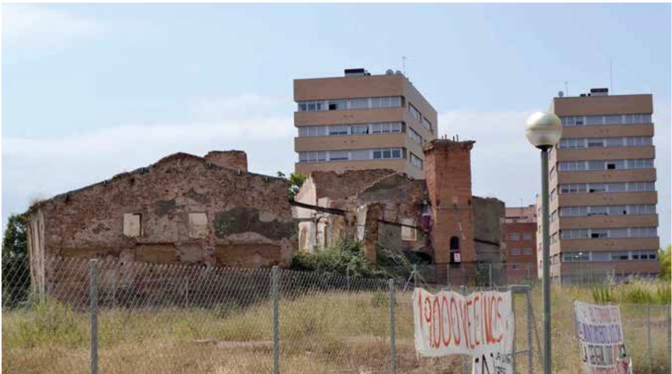
Figura 16. La masia de Can Llong, amb el nou barri construït al seu redós. De propietat municipal, actualment està en estat ruïnós i sense ús. Sabadell, 2012.