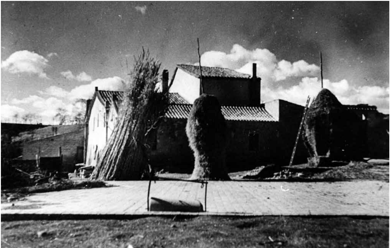
Figura 28. La masia de Can Puiggener, amb l'era en primer terme. Antigament, en el segle xv, era coneguda com a Mas Canals de Jonqueres. Sabadell, 1932.