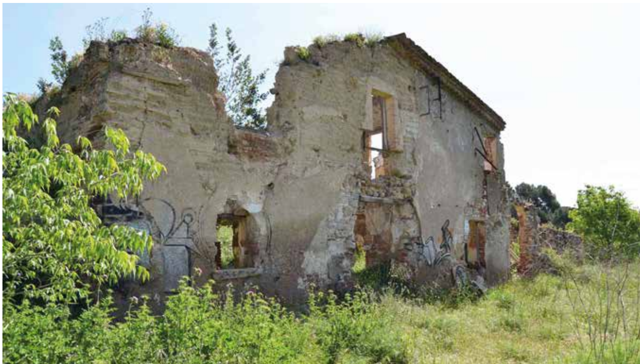
Figura 17. La masia de Can Fadó Vell es troba a l'oest del terme de Sabadell, prop del municipi de Polinyà; actualment està en estat ruïnós. Sabadell, 2013.