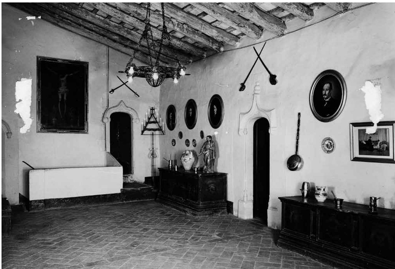
Figura 8. Sala noble de la masia de Ca n'Ustrell. Sabadell, 1973.