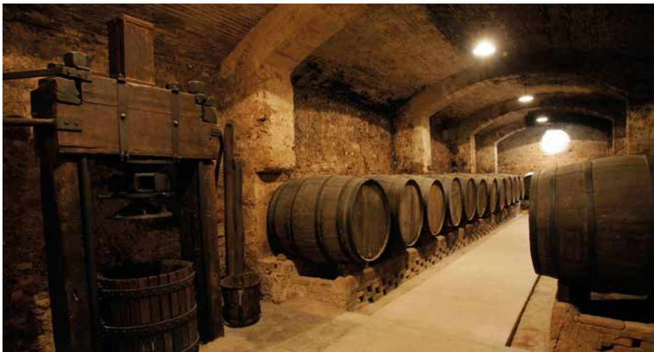
Figura 18. El celler de la Casa Duran del Pedregar, de finals del segle XVIII. La planta baixa d'aquest edifici conserva diverses dependències relacionades amb les activitats agrícoles que es portaven a terme en les terres i propietats de la família Duran. La Casa Duran és un punt museístic del MHS i patrimoni de la ciutat. Sabadell, 2004.