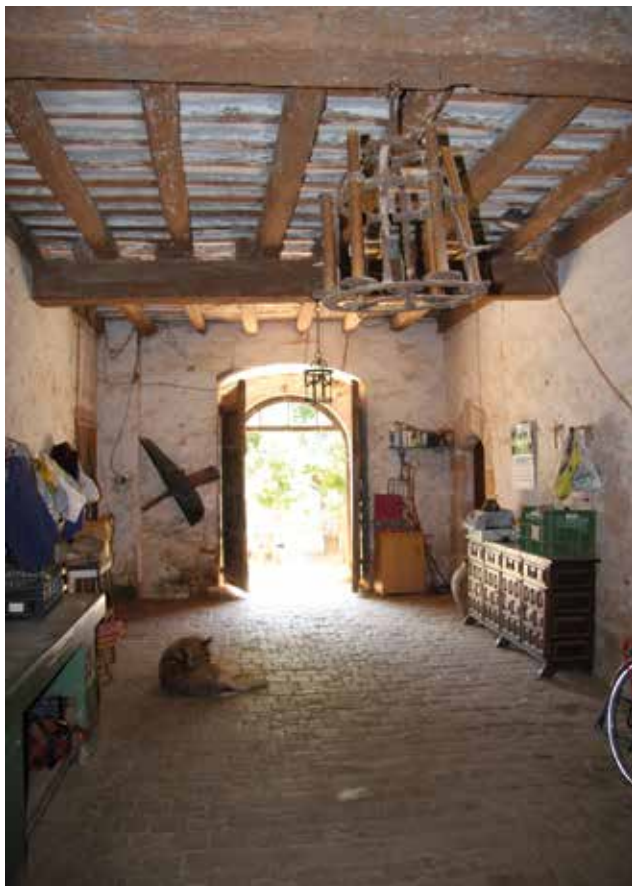
Figura 9. Interior de l'entrada de la masia de Can Vilar. Sabadell, 1 de juliol de 2016.