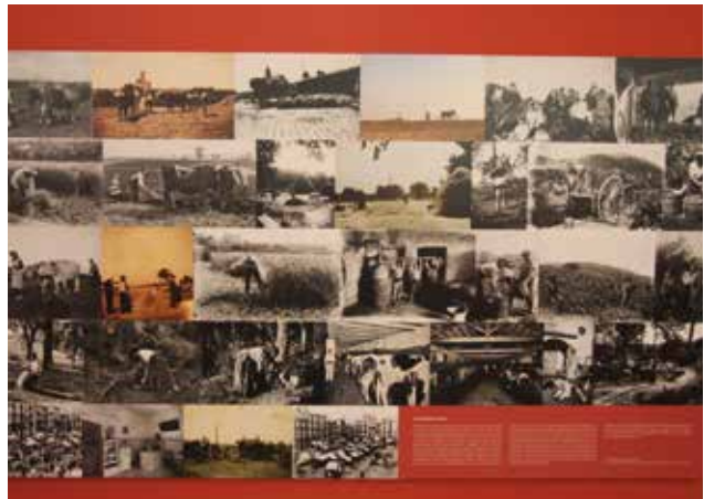
Figura 3, 4, 5, 6. Diferents imatges del muntatge de l'exposició "Arrels oblidades. Les masies de Sabadell al MHS". Sabadell, febrer de 2017.

torn, impulsada pel motor de la industrialització, les immigracions i el creixement demogràfic, i condicionada pels canvis econòmics i culturals de la nostra comunitat i, també, per les nostres paradoxes i contradiccions.