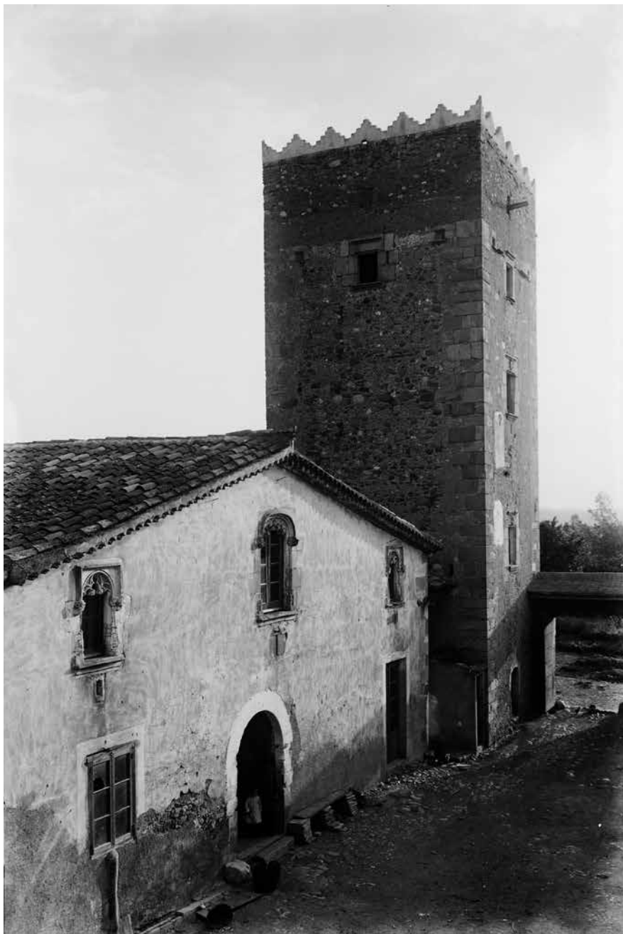
Figura 7. La masia de Torre Berardo o Castellarnau, amb la seva esvelta arquitectura, ornamentada i fortificada, es documenta d'ençà dels segles XIII-XIV. Sabadell ca. 1924.