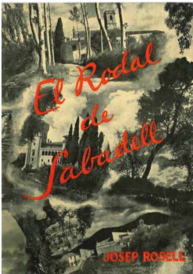
Figura 20. El llibre de Josep Rosell El rodal de Sabadell , de l'any 1937, és una obra fonamental per entendre l'empremta del llegat rural en la memòria ciutadana del Sabadell de les primeres dècades del segle xx (AHS).

venien i les transaccions que es feien. Els hostals de Manresa (...), el de Muntanya, el de Sant Antoni (...) i el de Sant Domingo, eren plens dels pagesos traslladats a Sabadell.” (Josep ROSELL, 1937, p. 148)