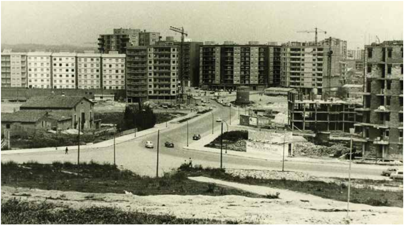
Figura 14. La masia de Can Borgonyó, amb el barri de la Concòrdia en plena construcció al seu entorn. Sabadell, 1971. La masia va ser enderrocada l'any 1977.