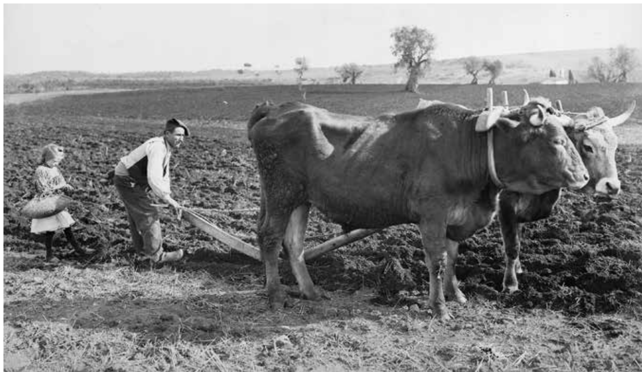
Figura 19. Pagès llaurant el camp amb una arada romana i un parell de bous com a animals de tir. Principis del segle XX.