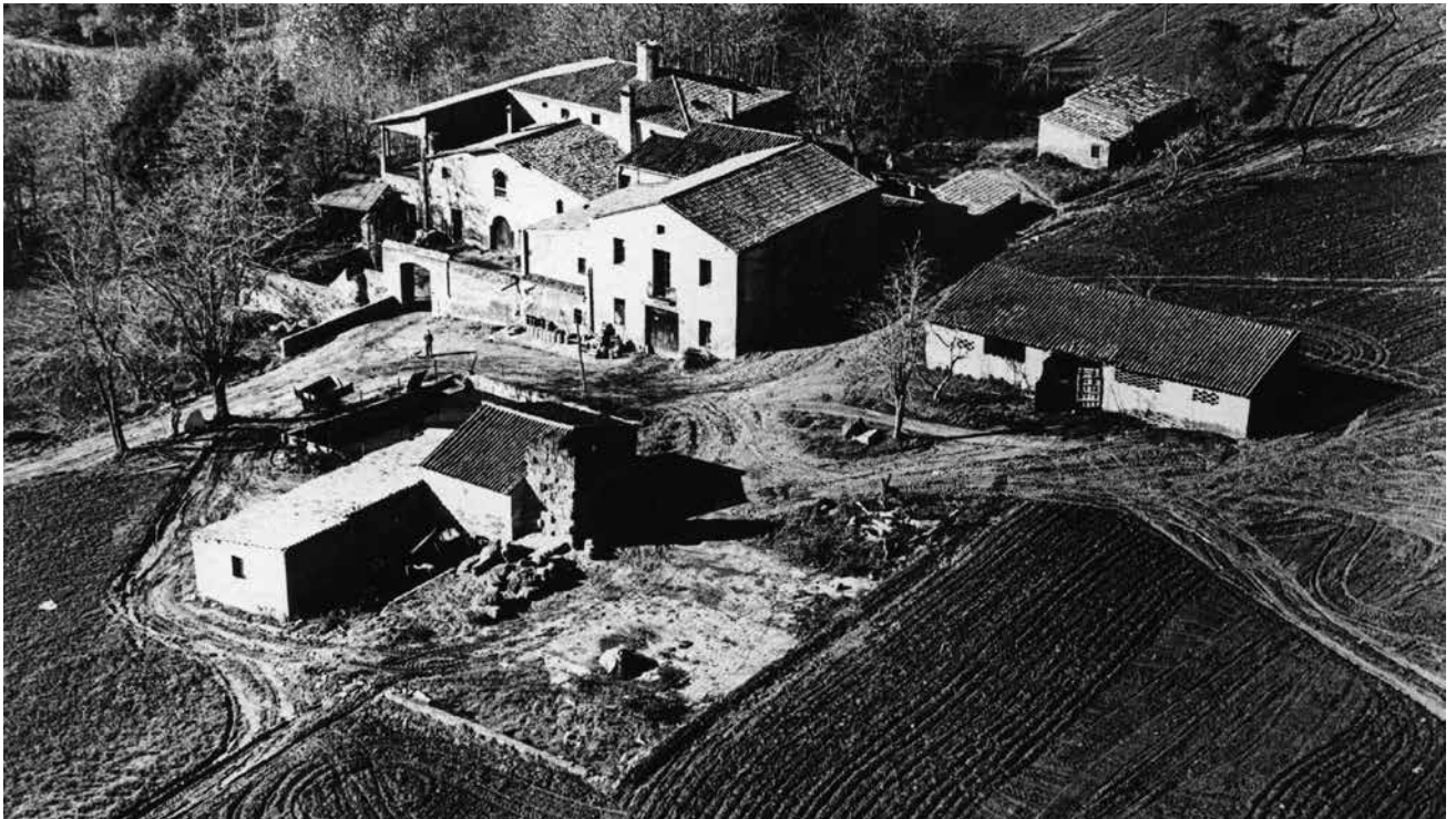
Figura 13. Vista aèria de la masia de Can Lletget. Sabadell, ca. 1967. Aquesta masia ara es troba en estat ruïnós.