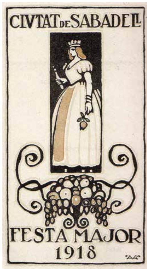
Figura 8. Festa Major de Sabadell, 1918.