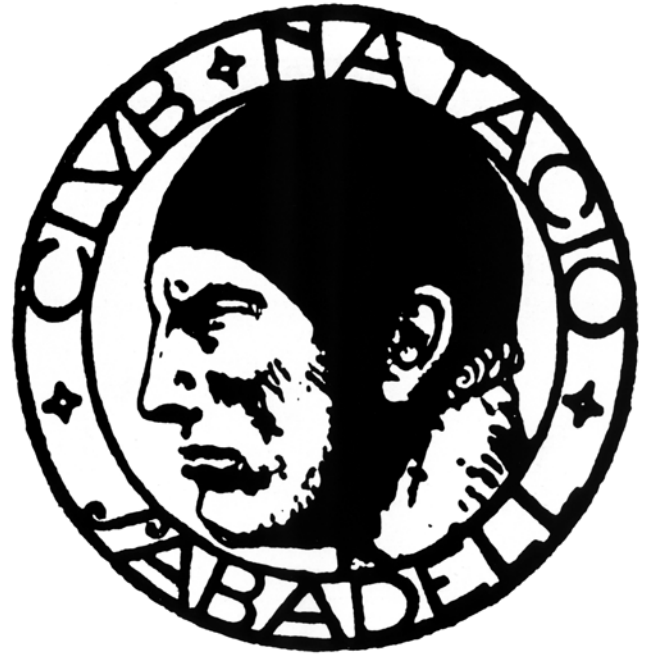
Figura 7. Club Natació Sabadell, 1918 (AFVG).

— Projecte de cartell per a la Festa Major de Sabadell (1917). Programa de mà