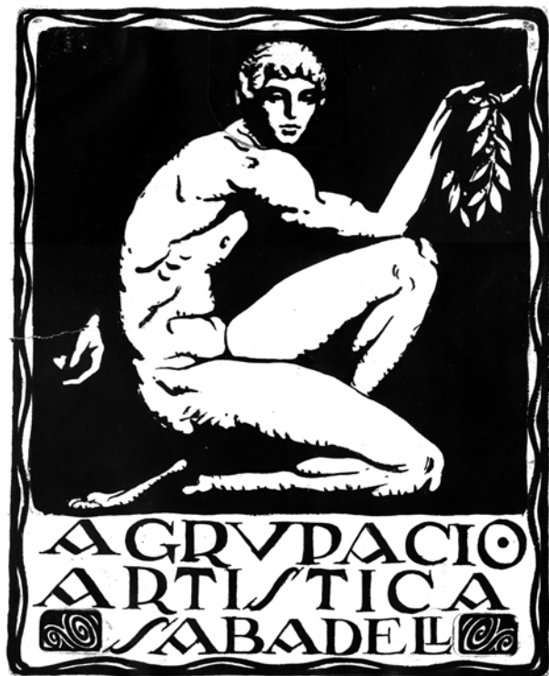
Figura 3. Agrupació Artística, 1914 (AFVG).