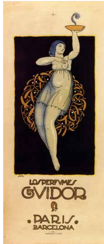
Figura 10. Perfums Guidor, 1920 (AFVG).

Aquest imprès, de format rectangular vertical, segueix plenament l'estètica noucentista i manté els criteris de senzillesa gràfica que es faran habituals en els grafismes de Vila Arrufat. És treballat a dues tintes: negra i ocre pàl·lid sobre el blanc del paper. Es tracta d'una composició centrada i geomètrica que representa la geganta de la ciutat. A sota hi ha una fruitera ben plena de la qual surten senzills arabescos decoratius i simètrics. El text apareix a la part superior i inferior de la il·lustració. Totes les formes en negre, lletres incloses, van resseguides per un traç de color ocre molt propi de l'època. L'autor signa, a la part inferior dreta, amb les inicials, AVA.