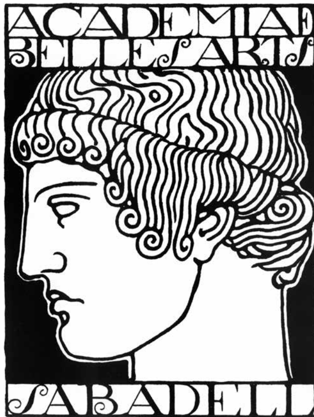
Figura 12. Acadèmia de Belles Arts de Sabadell, 1928 (AFVG).

tres són del tipus pal sec, amb elements decoratius. Està signat amb les inicials, AVA, a l'esquerra, sota el dibuix. Malgrat que és del 1920, aquest cartell té un aire déco , per la simplificació formal amb què es representa la figura.