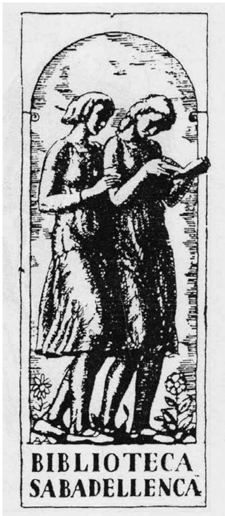
Figura 9. Exlibris Biblioteca Sabadellenca, ca. 1920 (AFVG).

— Programa de mà de la Festa Major de Sabadell (1918)