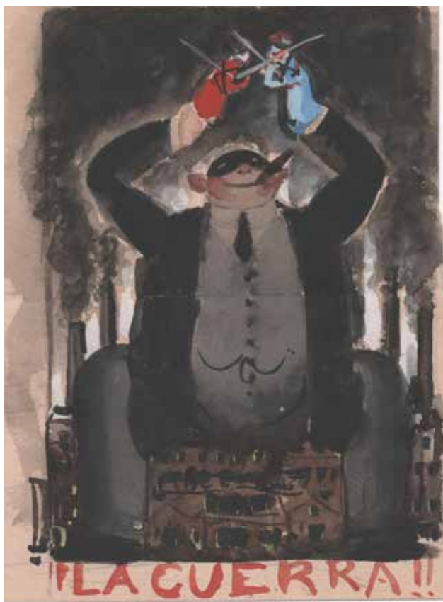
Figura 14. Projecte de Cartell La Guerra 1932-1937.