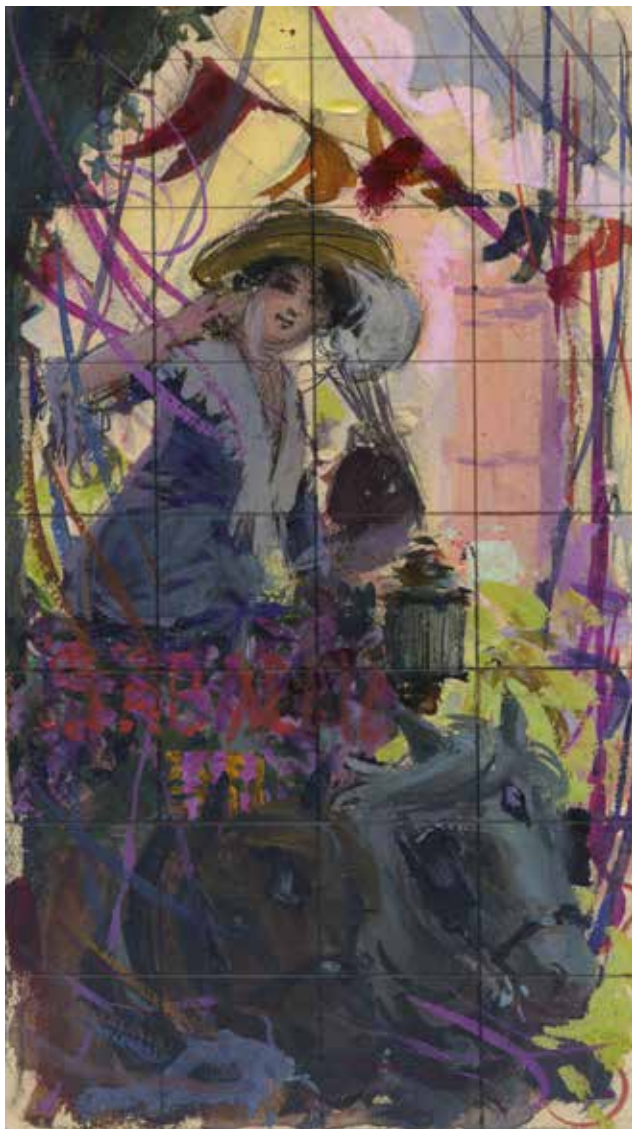
Figura 2. Esbós Festa Major Sabadell "Serpentinas", 1912 (AFVG).

lets, en la manera com són pintats, hi veiem una certa semblança amb els fanalets del cartell que el seu pare, Joan Vila Cinca, va fer per a la Festa Major del 1905. En tot cas, com que tots dos treballaven al mateix estudi, ens sembla ben probable la influència. Tornant al cartell, el fons blavós es combina amb un estol de coloms blancs que, des de primer terme, a la dreta, es perden en la llunyania. A la part superior esquerra s'hi llegeix el lema " Sebendunum ". Realitzat al guaix, fa 110 cm x 70 cm.