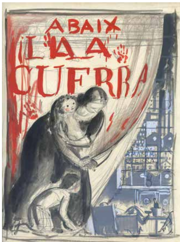
Figura 13. Projecte de Cartell Abaix la Guerra 1932-1937.