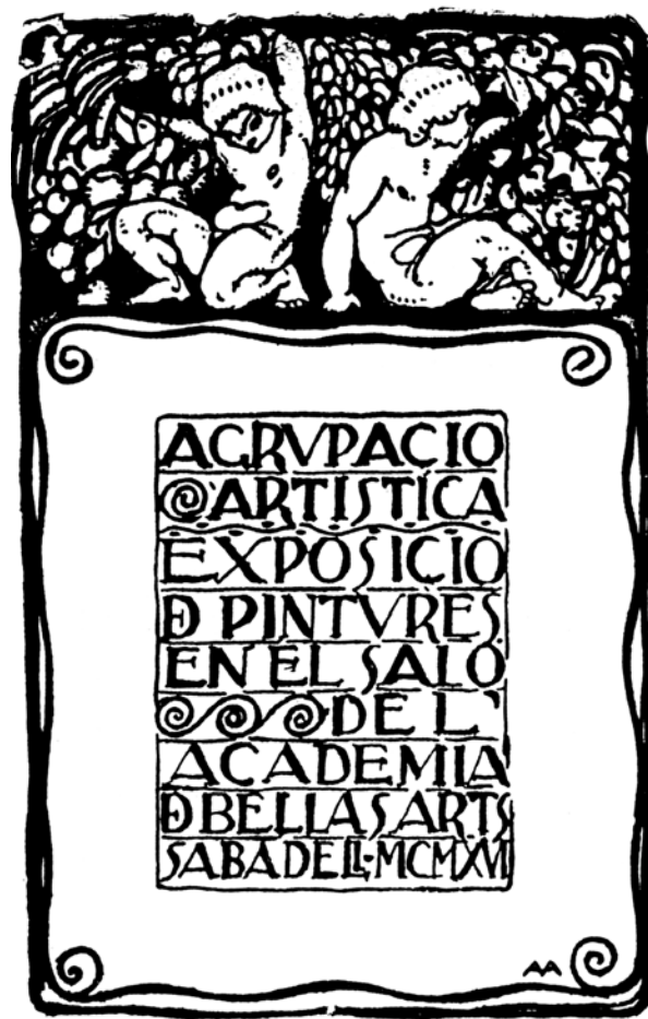
Figura 4. Díptic de l'Exposició Agrupació Artística, 1916.

nitiva. També ho són els elements principals que ja romandran en la versió definitiva.