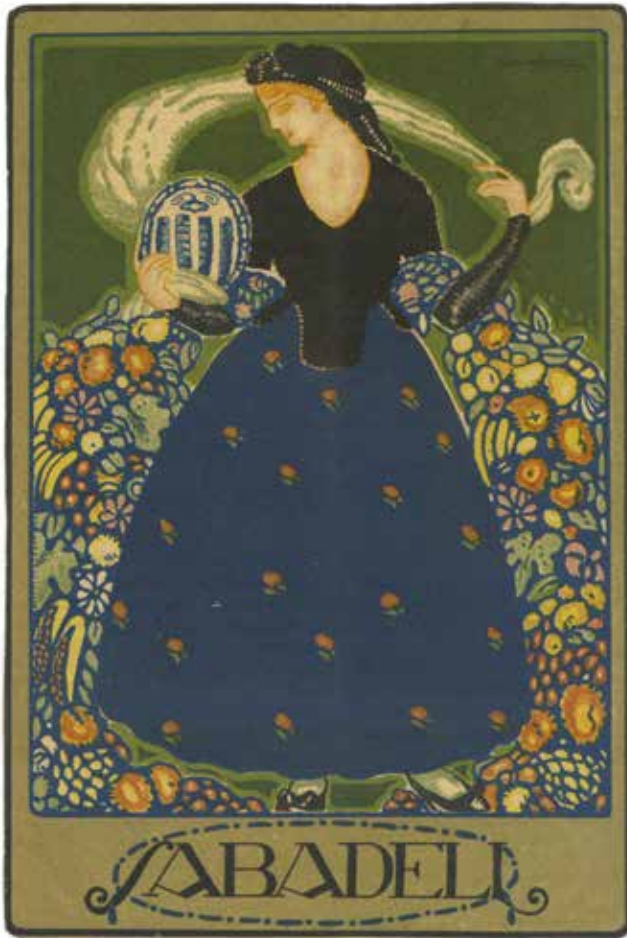
Figura 6. Programa de mà de la Festa Major, 1917 (AFVG).

o troncs que baixen fins a la part inferior del format, on veiem una corona centrada i dos escuts a dreta i esquerra; en el de la dreta hi ha les quatre barres i el de l'esquerra sembla que representa una ceba (en al·lusió a l'escut de la ciutat) amb la tija fent arabesc. Tanquen el dibuix per sota dels escuts un seguit de troncs o potser arrels que formen gairebé una sanefa entortolligada amb el filacteri. En conjunt, és una imatge amb un cert carregament visual. Cal afegir que aquest tipus de documents solien ser certament recarregats. 13 Està signat a la part inferior dreta i fora del dibuix, en un requadre: "Antoni Vila Arrufat 1917".